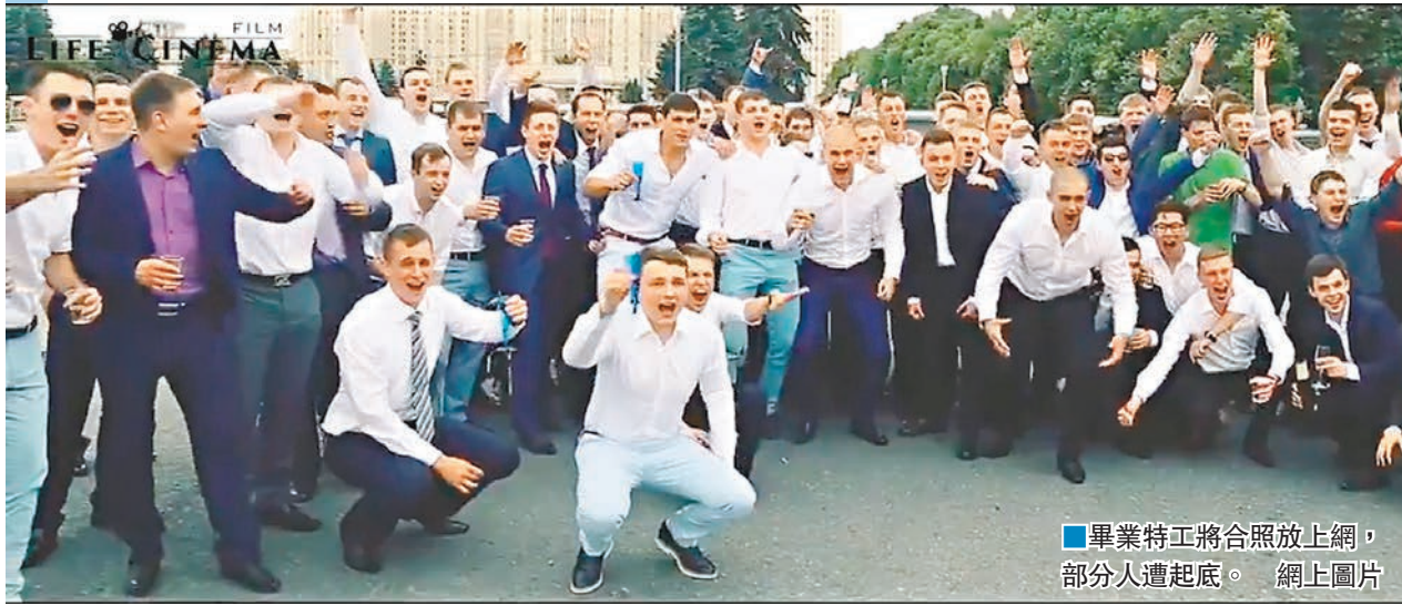
畢業特工將合照放上網，部分人遭起底。

俄羅斯聯邦安全局(FSB)一批剛從外國情報部門畢業的特工，早前於首都莫斯科街頭招搖過市，租下多輛平治轎車組成車隊，在街上響號之餘，更打開車窗振臂高呼，他們下車後甚至拍大合照，並將片段及照片上傳互聯網，令這批未來特工的身份曝光。克里姆林宮已下令特工學院及FSB首長徹查，這批特工恐面臨革職等處分。