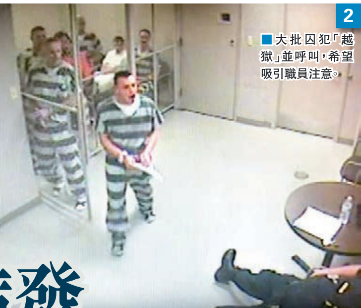
大批囚犯「越獄」並呼叫，希望吸引職員注意。