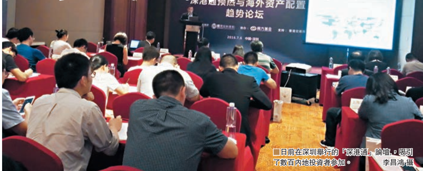
日前在深圳舉行的「深港通」論壇,吸引了數百內地投資者參加。

香港文匯報訊(記者 李昌鴻)憧憬A股入MSCI推「深港通」,內地資金湧港掃貨,港股通自5月份起資金淨流入激增,至上周五約兩個半月,淨流入達651億元(人民幣,下同),其中6月份達371億元,較5月份暴增69%。深圳日前一個「深港通」論壇上有與會者指出,在人民幣貶值、資產荒持續的內地投資大環境下,港股低估值的窪地效應及高分紅的特點,對內地投資者及基金有很強的吸引力,「深港通」的開通,內地投資者搶頭籌大戰一觸即發。