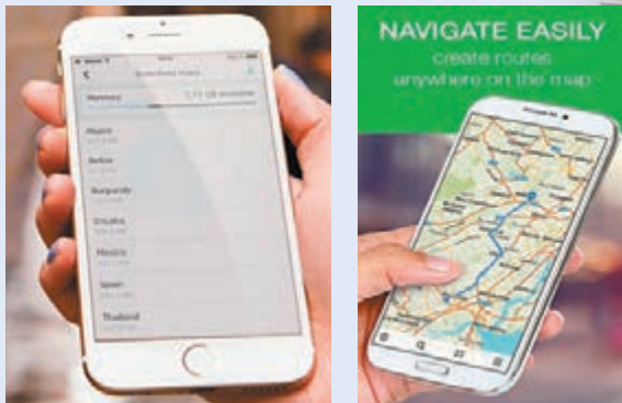
在WiFi環境下不用擔心數據問題，可安心下載當地的地圖。

除預先租用了WiFi蛋，否則在使用有限數據的數據卡下，人們未必願意無止境地開啟Google Map來指點路途，因此出發前預先下載目的地之地圖方為上策。市面上有不少地圖app，有收費亦有免費，當中較值得推薦的是同樣對應iOS與Android系統的MAPS.ME和HERE Maps，皆因兩者也是以英語作基礎，較方便港人使用。MAPS.ME的圖標顯示相對較細緻，連沒有網絡都能夠運作，現時更對應全球345個國家或地區，囊括絕大部分旅遊熱點，惟缺點是它經由GPS取得閣下位置，所以一旦用得久，手機電量便有如倒水般快。