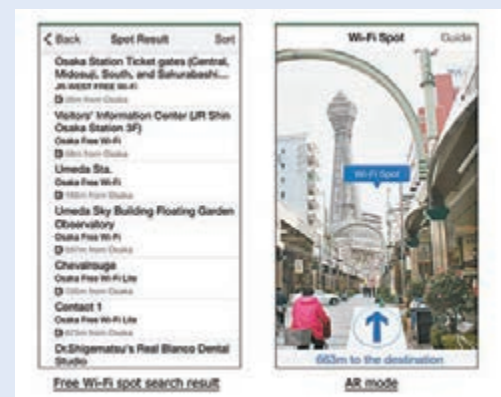
Navitime現在甚至連wifi熱點都能找到。

屬針方能取出sim卡，換卡又有機會意外掉落，更無法接收香港的緊急來電，整體而言弊多於利。