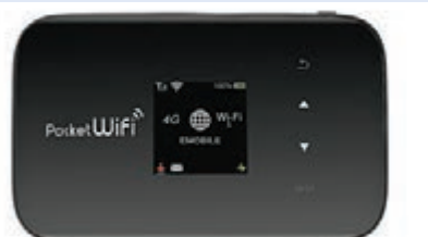
儘管租用成本較貴，但WiFi蛋的優點還是多於缺點。

因為上述的app連同使用facebook和IG等，都會消耗手機不少電量，加上影相拍片以至WhatsApp等日常功能，隨時未夠半日便「乾塘」。所以「尿袋」亦是當今外遊的必需品之一，建議別用電量少於5000mA的這類產品，免得經常要為它「回血」。至於WiFi蛋和數據卡該選用哪款方面，筆者是傾向前者，一來可讓幾部手機連上網絡，適合兩口子以至全家需要。二來iPhone要用金