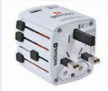
旅行萬用插頭雖大行其道，但建議選用可連接USB的產品。

不僅是出trip人士，即使一般旅客也要面對用電問題，就算不帶手提電腦同行，這個世代任誰都會有部智能手機，看地圖、上網以至睇片解悶全靠它，故必須解決充電問題。以往去不同國家要準備不同轉插，現在已有用途更廣的萬用插頭，兼且備有USB插頭，像赴日的话只要把萬用插頭接上手機充電線，同一時間還可替「尿袋」（攜帶電源）和相機充電，非常方便，不用擔心酒店房間不夠插位的情況。