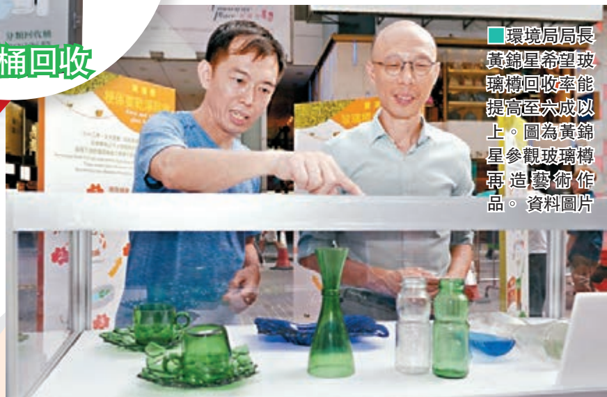
■環境局局長黃錦星希望玻璃樽回收率能提高至六成以上。圖為黃錦星參觀玻璃樽再造藝術作品。

以前，本港循環再造飲品玻璃樽的出路狹窄，但隨着科研工作不斷進步，飲品玻璃樽經過適當處理，可用作製造多種不同的建築物料，例如地磚等。有見及此，黃錦星希望玻璃樽徵費計劃實施後，玻璃樽的回收率可由現時約一成，大幅提升至六成或以上。