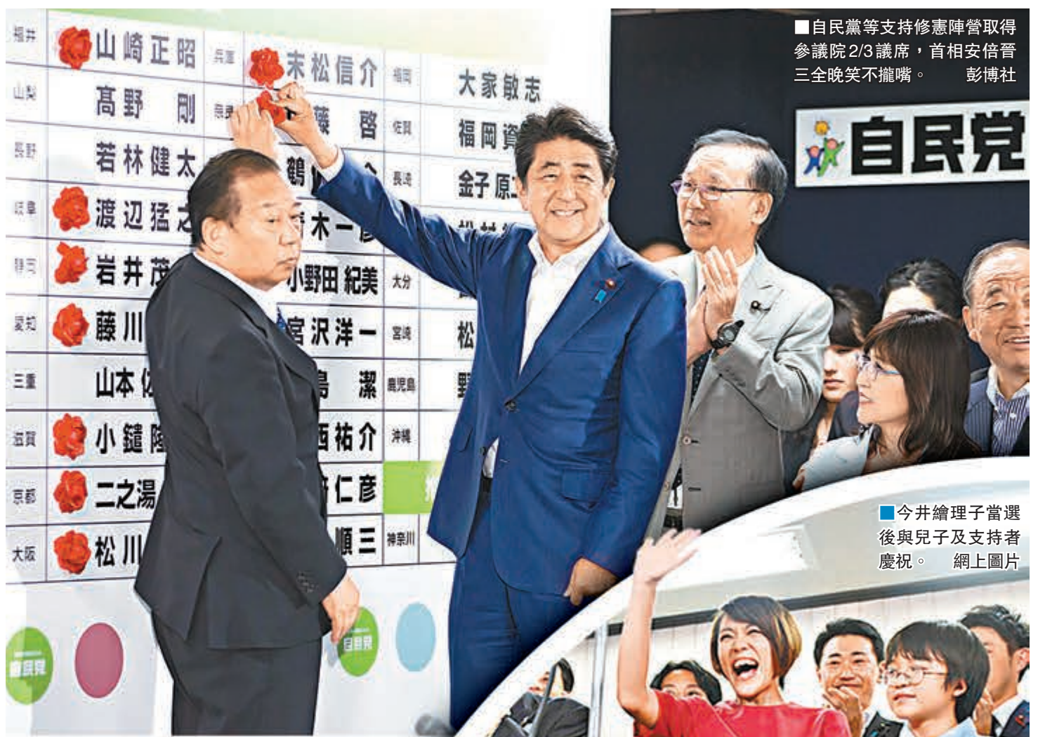
自民黨等支持修憲陣營取得參議院2/3議席，首相安倍晉三三晚笑不攏嘴。