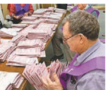
澳洲大選點票至今仍未完成。

舉造成「災難性」後果，不建議全國層面的選舉採用，目前只有失明或弱視人士可利用電話系統協助投票。《悉尼先驅晨報》/澳洲廣播公司