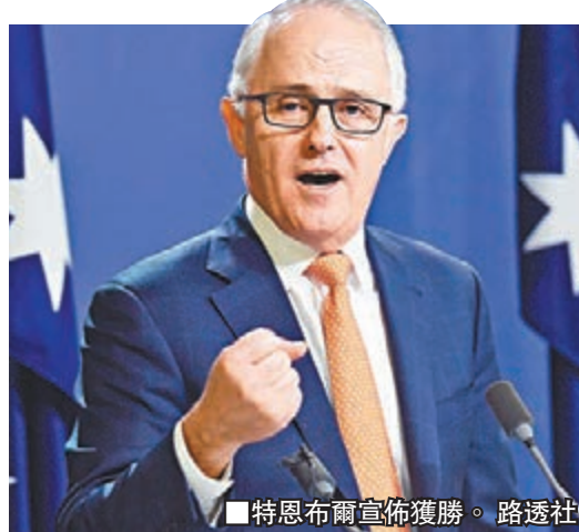
特恩布爾宣佈獲勝。