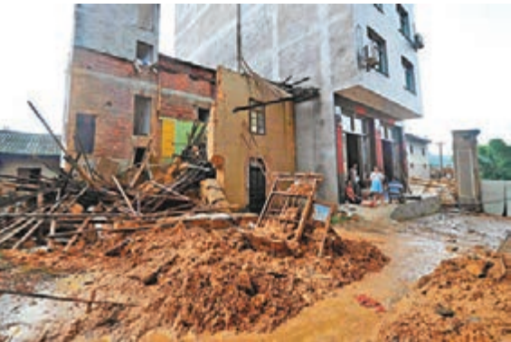
福建閩清縣白樟鎮樟山村中一片狼藉，不少房屋已被洪水沖毀。

武警部隊在閩受災各處連夜奮戰，疏通河道、疏通塌方公路、架橋等。昨日，受災鄉鎮的交通、水電、通訊等已開始陸續恢復。據通報，福建超過75%受災停電用戶已恢復供電；政府開始給受災居民發放各種