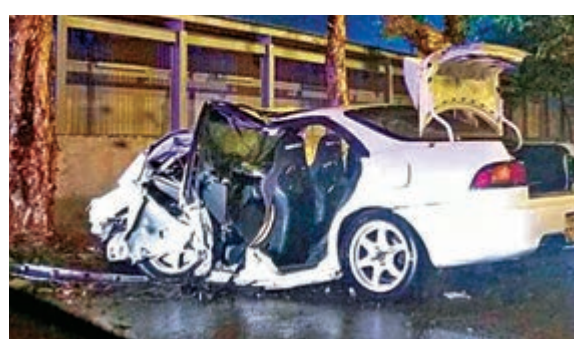
■掛「P牌」白色跑車在元朗大井圍對開失控撞大樹,全車嚴重毀爛。

香港文匯報訊(記者 杜法祖)元朗、葵涌及銅鑼灣8小時內先後發生3宗涉及「P牌」車輛的交通意外,其中在元朗宏樂街一輛跑房車失事撞向路邊大樹,司機與男乘客當場浴血被困,須由消防員救出送院,當中乘客口鼻噴血命危,司機則涉危險駕駛被捕。另外兩宗「P牌」車禍則有驚無險,無人受傷。