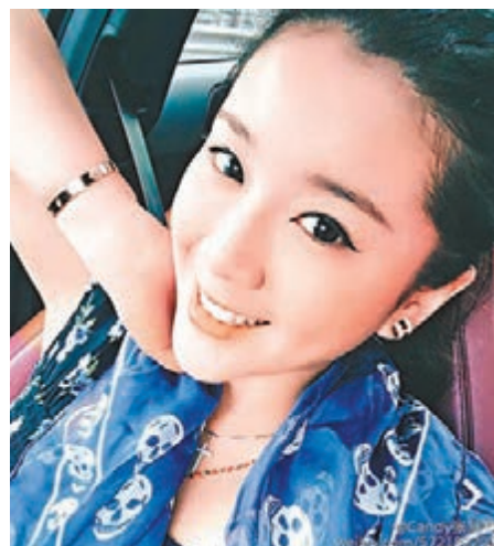
■前華姐張慧雯 微博圖片