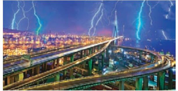
■本港前晚雷電交加,廣泛地區出現閃電。

1萬次閃電中,逾半在前晚的黃色暴雨警告期間出現,由前晚9時起,短短兩小時內已錄得5,037次閃電,當中新界東已出現2,260次閃電。前晚雷雨交加,但閃電頻率之密,使晚空變得明亮,吸引不少市民舉機拍下大自然奇觀,並上載至網上分享。天文台表示,前晚閃電次數未算歷來最高,以往也常於夏季或秋季的單日內錄得逾萬次閃電。由天文台2005年開始記錄閃電次數資料顯示,歷來閃電次數最厲害的日子於2010年9月9日,單日錄得逾1.4萬次雲對地閃電。天文台高級科學主任黃偉健表示,前日受超強颱風「尼伯特」的外圍下沉氣流影響,廣東內陸地區有很多雷雨區發展,影響本港,令多區均錄得閃電。