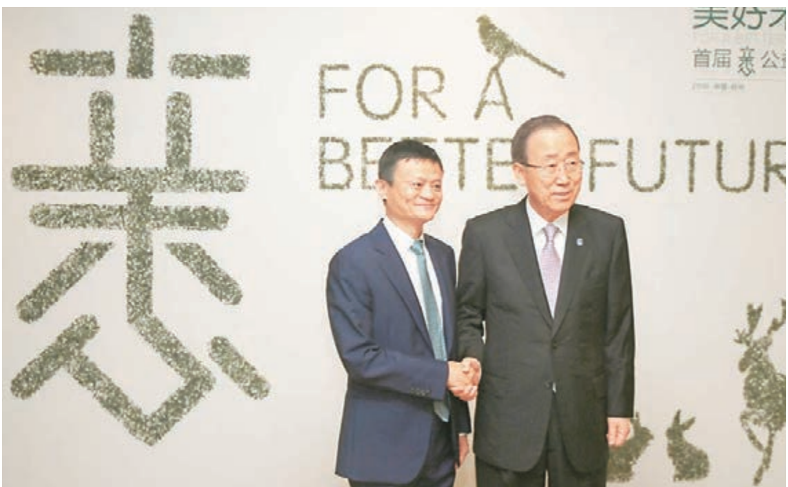
■ 首屆XIN公益大會在杭州舉行，聯合國秘書長潘基文(右)和阿里巴巴集團主席馬雲會面。

香港文匯報訊(記者 俞晝 杭州報道)由阿里巴巴和杭州市政府主辦的首屆全球XIN公益大會9日在杭州舉行。阿里巴巴集團董事局主席馬雲表示，公益不是花了多少錢，公益是看你喚醒了多少愛心，而「公益的心態、商業的手法」使公益行動可持續發展下去。自2010年起，阿里巴巴集團每年將營業收入的千分之三用於公益，並於2011年成立阿里巴巴公益基金會，專注推動中國環境保護領域的發展。