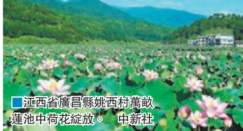
■江西省廣昌縣姚西村萬畝蓮池中荷花綻放。

姚西村，是江西第二大河——撫河源頭下的一個小村莊，也是世界集中連片種植面積最大、觀賞性最強的蓮花種植村莊。