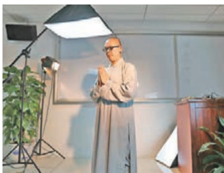
■學生們以《我心中的本煥學院》為題自編自導自演微电影。 本報深圳傳真