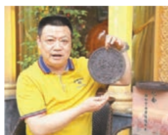
■李玉偉製作的鄭和紀念茶餅，成為沿海一帶漁民的吉祥物。