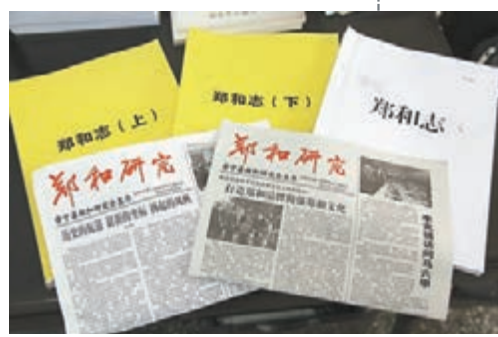
■晉寧縣鄭和研究會的部分研究成果。

楊爾文評價：《永樂大航海》和《鄭和九十九》，堪稱當今世界鄭和研究「雙璧」。《永樂大航海》是目前最全面最細緻最生動再現鄭和亞