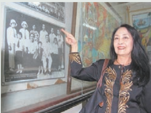
■鄭和後裔到訪晉寧。

眾所周知，鄭和的身份是一名宦官，由此引出一個很有爭議的話題：鄭和何來子嗣？早年鄭和被明軍捉住，送到當時北平燕王朱棣府上做了一名宦官，因此鄭和的確沒有親生兒女。