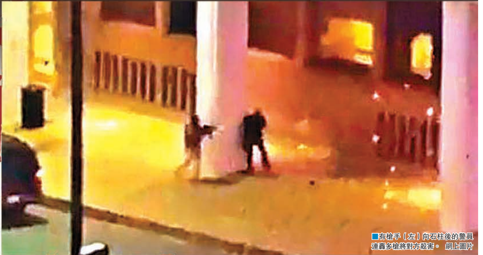
有槍手(左)向石柱後的警員連轟多槍將對方殺害。網上圖片