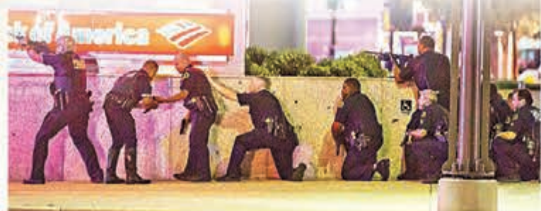
大批警員搜索兇徒，氣氛緊張。