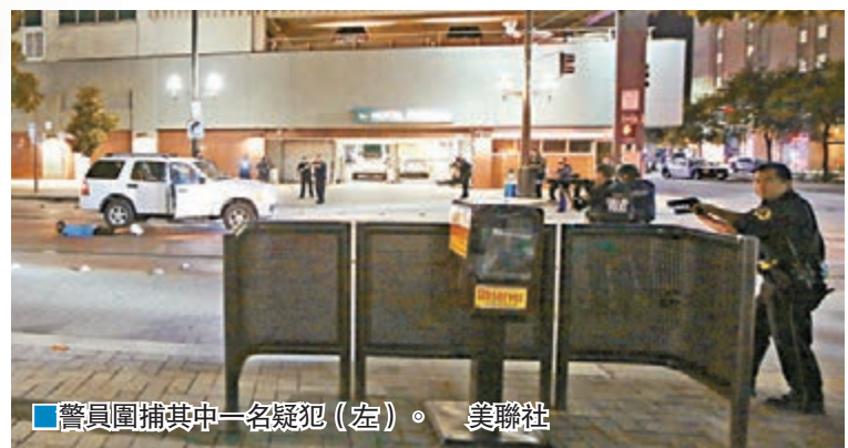
警員圍捕其中一名疑犯(左)。