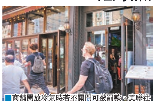
■ 商舖開放冷氣時若不關門可被罰款。美聯社

每逢夏天，紐約不少店舖都會「中門大開」，將冷氣釋出街上吸引客人，但此舉經常被指浪費資源。當地在本月1日實施新例，嚴禁商舖在冷氣開放時打開門窗，違者罰250美元(約1,939港元)。商戶對新法意見分歧，支持者認為可有效節約能源，反對者批評當局無權要求商戶不開門，亦質疑如何執法。 新例擴大2008年類似條例的適用範圍，由大型連鎖店擴至所有商戶。紐約市官員指，如1萬間商舖在開冷氣時關門，減少的碳排放量將相當於3,600輛汽車。有店主擔心，假若送貨工或客人離開時沒有順手關門，可能連累商店受罰。 ■ 美聯社