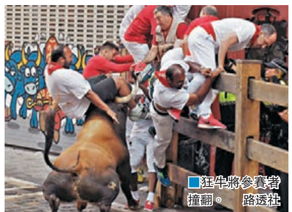
■ 狂牛將參賽者撞翻。

侵犯集會。不過由於民眾歡慶時容易醉酒鬧事，加上活動宣傳品往往印有女性袒胸露背、任由男性撫摸的照片，似有鼓勵性罪行之嫌，因此備受爭議。 ■ 法新社/路透社/《每日鏡報》