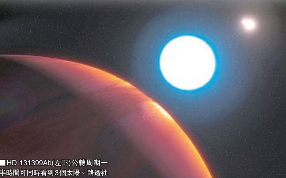
■ HD 131399Ab(左下)公轉周期一半時間可同時看到3個太陽。

公轉一次550「年」 HD 131399Ab位於半人馬座星系內，質量是木星的4倍，形成於1,600萬年前，是人類發現的最年輕系外行星之一。它圍繞星系內最大恒星的公轉周期為550個地球年，當中一半時間在行星上可同時看到3個太陽，光芒較弱的兩個太陽之間距離較近，並與第3個太陽分開。但隨着行星運行至某段軌道，會出現兩個小太陽落下時，大太陽隨之升起的現象，代表行星上會是永久白晝，這段時間佔公轉周