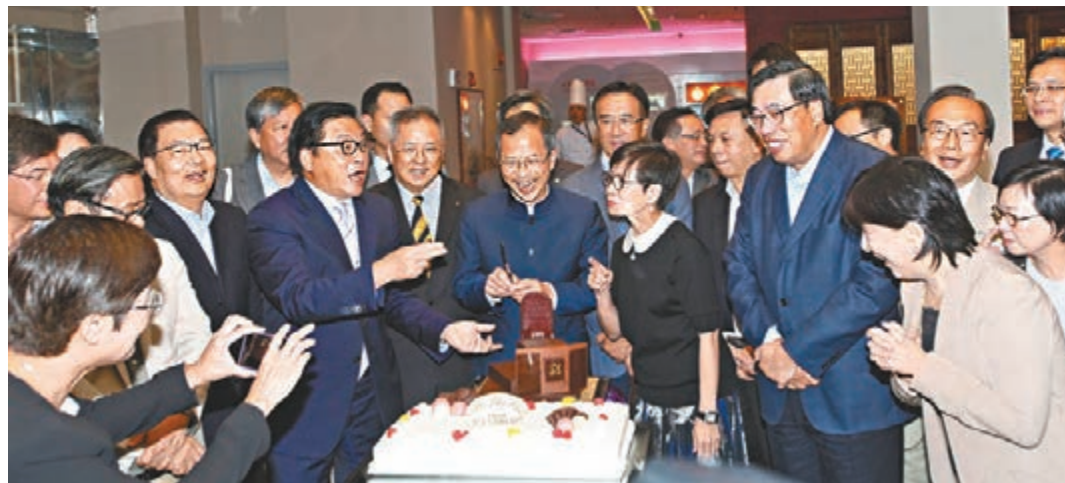
議員昨日饒別立法會主席曾鈺成，送上「主席台」大蛋糕。