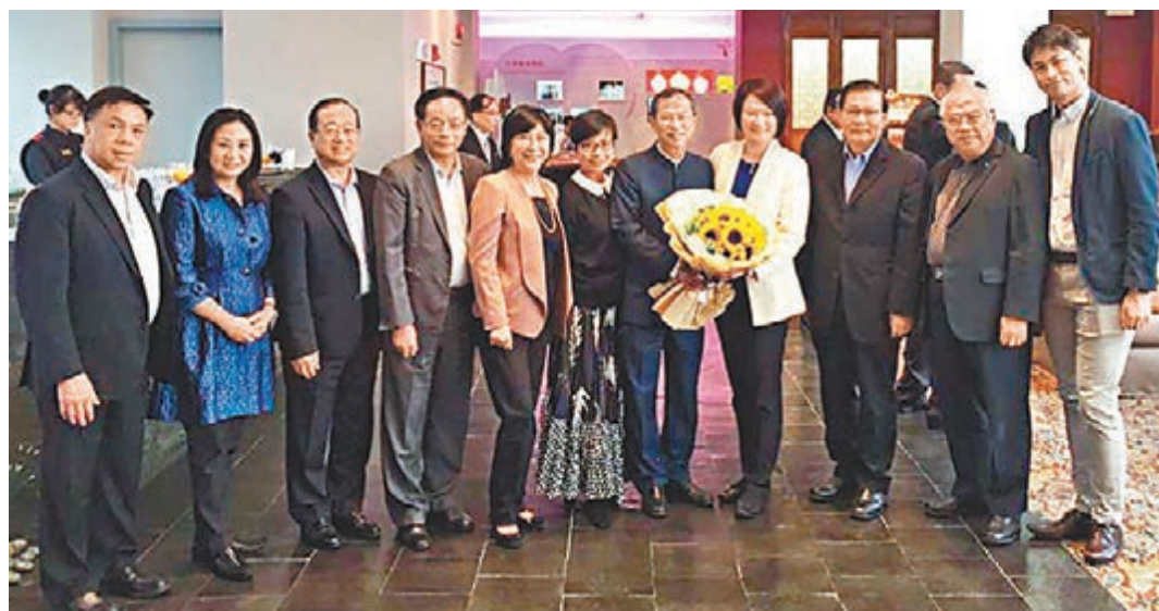
民建聯議員為曾主席預備了一束太陽花。