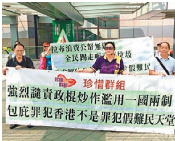
「珍惜群組」拉起橫額遊行到立法會示威區，批評有政棍破壞香港。

他們續稱，要打倒拉布議員，批評反對派議員多年來不斷在議會內拉布，既阻礙香港發展又浪費公帑，有關行為絕對不要得，又指，反對派議員濫用免遣返聲請包庇假難民，直接影響香港治安，更以此作為自己的政治籌碼，令香港近年受罪犯暴徒及假難民影響，故強烈要求馬上送走假難民，盡快回復社會安寧。