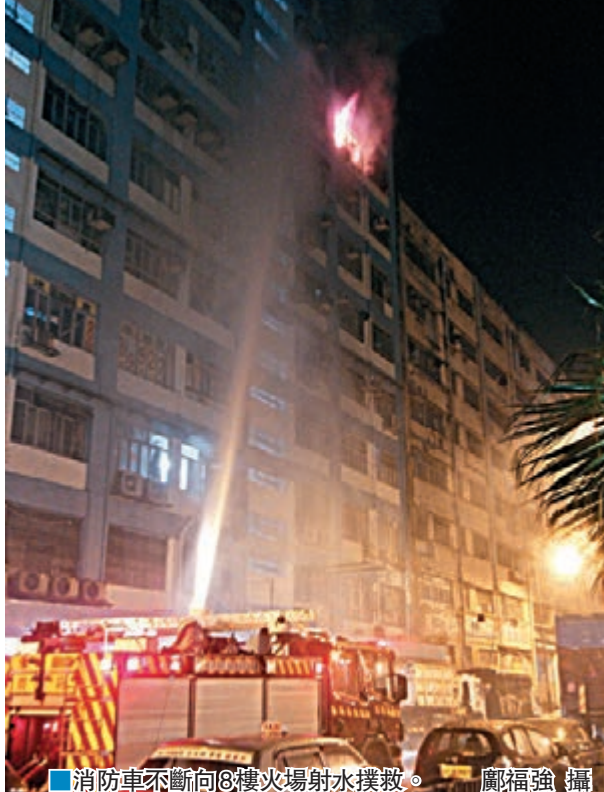
■消防車不斷向8樓火場射水撲救。

熊，火舌捲窗而出，大批消防員接報到場撲救。凌晨0時19分，火警升為三級，消防動用鋼梯水塔於外牆射水，防止火勢蔓延至其他單位，又派出煙帽隊登樓灌救及疏散大廈內的人。