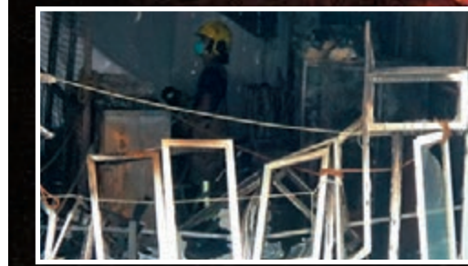
■昌發工廈發生三級火的單位不斷有烈焰噴出(大圖)，焚毀後窗框燒至扭曲變形(小圖)。