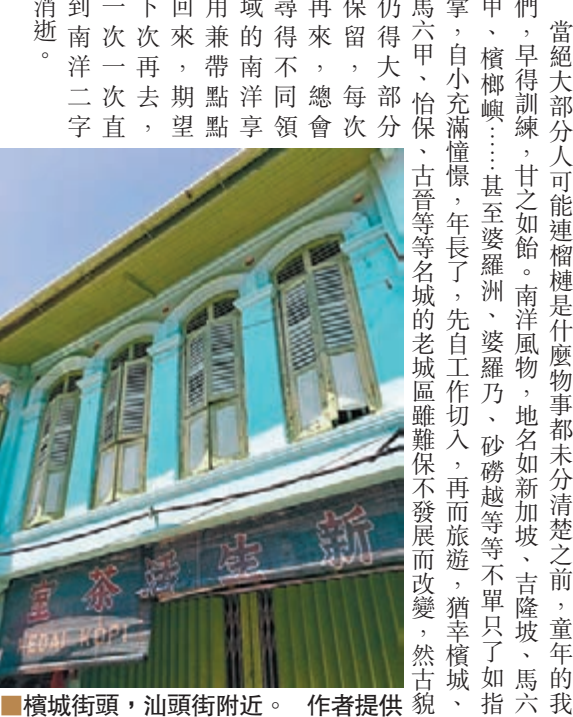
橫城街頭，汕頭街附近。

那些年的新界，一般人不要說習慣，根本不會在家中喝咖啡，若祖父開張在家，總會搬出一套煮弄咖啡的架生，在天台上慢慢慢煮，沖落小杯讓我們兄弟分享，雖然那種苦澀到成長之後才分得出是甘香，夜空中飄揚有別一般的氣息著實吸引。很多年前，先在新加坡，後在吉隆坡、檳城、怡保、馬六甲街頭喝過過人一天幾杯地叫叫咖啡，帶甜奶的咖啡，加冰叫「冰咖啡」，也喝過無糖無奶咖啡叫「K.O.」，那種濃烈烈異香就是祖父在我們童年訓練飲過的滋味。