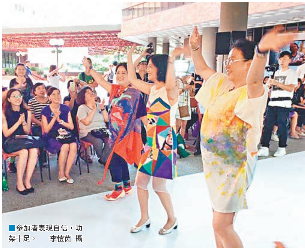
參加者表現自信,功架十足。

與精神康復者合作設計,並不是想像中單單以服裝設計達到「心靈治療」效果,由同學協助康復者建立自信,而是互相學習,相互影響。過程中,雙方的關係不只是合作夥伴,更成為了朋友,真正達到社會共融。香港善導會總幹事吳守增表示,活動對參加者得益十分大,盼他們能將不同群體緊密連接,做到社會共融。