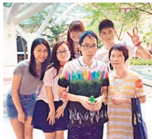
同學鼓勵使俊民打開心扉,以短句表達自己。