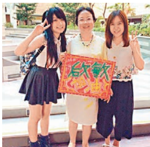
啟敏手持理大同學為她所製的打氣牌,和理大同學合照。