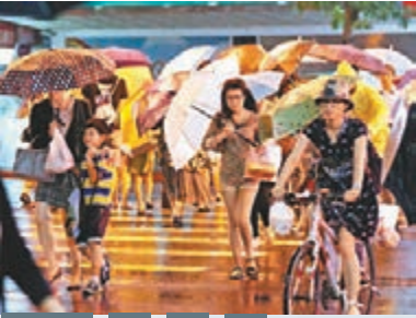
台北暴雨漸近

前仍有許多土石流紅色警戒區的居民尚未撤離，希望他們能盡速與地方確認，並做好預防性撤離。