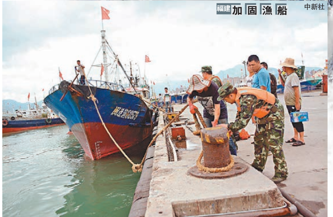
福建加固漁船

桃園機場統計至7日晚間18時為止，出境取消35班，入境取消75班，延誤12班；另貨機取消18班，延誤6班，總計146班，受影響航班佔總航班約24.3%。台灣「交通部長」賀陳旦說，上次發生淹水的成因，這次保證不再發生，但不敢保證100%不會漏水。台灣「行政院長」林全指出，目