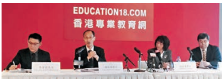
香港專業教育網公佈2016年第十八屆香港最佳大學排名,港大在「民意排名」榜中,16年來首失第一名。

香港專業教育網的香港最佳大學排名榜分為多個部分,其中「民意排名榜」近16年來均與港大民研合作進行,今年排名榜隨機訪問了逾1,200名市民,要求他們按聲譽、學術研究表現、學生成績及品行質素等,由0分至10分為各大學評分。與過去15年來港大、中大及科大一直分列前三位情況不同,今年該「民意榜」出現驚人變化,自一年多前違法「佔中」以來展現政治風波的港大分數大跌,排名跌至第三與科大對調,而中大則維持第二。