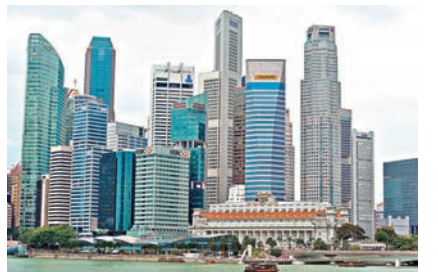
英國脫歐引起的不明局面，加速資金轉移亞洲。圖為新加坡金融區。

高，新興亞洲則是受到英國脫歐影響最小的區域，亞洲國家對英國出口僅佔GDP的0.7%，不論英國或整體歐盟，皆非亞洲國家出口成長動能之主要來源，因此，英國脫離歐盟對於亞洲國家實質經濟影響不大。