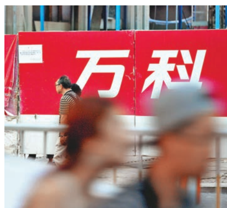
復牌第三天的萬科A昨天延續瘋狂行情,全天成交201億元人民幣。

周二萬科A雖一字跌停,但成交卻增至39.39億元,其中收盤前15分鐘內成交高達36億元。晚間,萬科公告稱,鉅盛華於當日購入萬科A股票7,529.3萬股,佔公司總股本0.682%,令鉅盛華及其一致行動人合計持有萬科股份達到24.972%。以萬科A當前股價計算,鉅盛華周二共耗資約14.9億元,佔總成交額的37.83%。