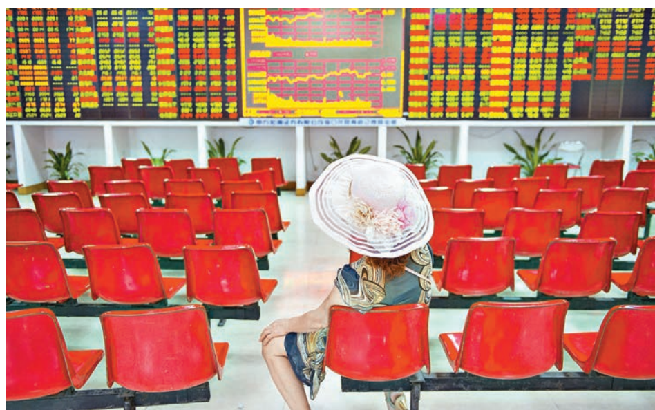
上證綜指昨收報3,017點,升0.36%。圖為一位戴太陽帽的股民關注大盤走勢。

香港文匯報訊(記者 章蘿蘭 上海報道)相較於萬科A的巨震,滬深兩市全日走勢平淡。兩市雙雙低開,滬指跌0.26%,再失3,000點。萬科A打開跌停板