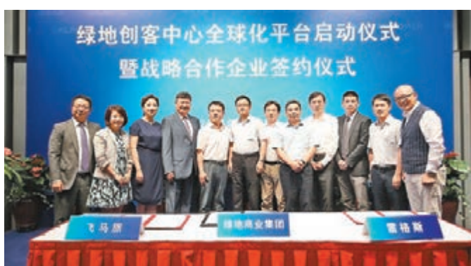
綠地與中國電信天翼創投等一批合作夥伴簽署戰略合作協議。

公司稱，此舉旨在進一步帶動旗下商辦項目的運營與物業增值。 據悉，綠地當日與中國電信天翼創投、杭州東部軟件園、雷格斯、飛馬旅等一批合作夥伴簽署戰略合作協議，將協同打造眾創平台，合作類型涵蓋創業企業孵化、服務和投資。 根據合作協議，綠地控股將依托旗下上海徐匯綠地續紛城等項目與四家企業開展合作。