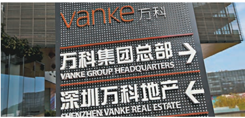
萬科復牌次日繼續跌停，消息指寶能在收盤尾聲階段增持萬科，其持有萬科股權比例已超過25%。

香港文匯報訊（記者章蘿蘭、蔡競文）萬科A股復牌第二天，一如市場所料繼續一字跌停，但成交額較周一大增，至39.4億元（人民幣，下同）。至收市，仍有折合資金超過100億元的賣單，同時尾盤盤合競價期間成交逾9億元。內地21世紀經濟報道引述消息稱，寶能在收盤尾聲階段增持了萬科，其持有萬科股權比例已超過25%。