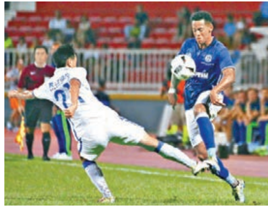
廣州富力(白衫)昨晚與來訪的史浩克04進行了一場挑戰賽。結果富力以1:6慘敗。

新一季港超聯11支參賽球隊為：東方、傑志、南華、冠忠南區、香港飛馬、元朗、大埔、流浪、港會、港菁及廣州富力。