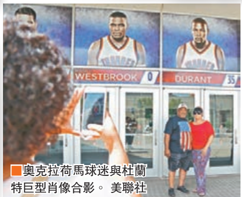
奧克拉荷馬球迷與杜蘭特巨型肖像合影。