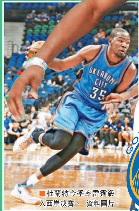
杜蘭特今季率雷霆殺入西岸決賽。資料圖片