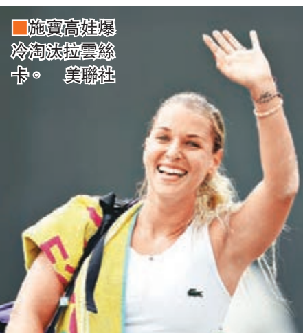
施寶高娃爆冷淘汰拉雲絲卡。