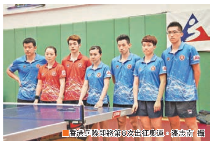
香港乒隊即將第8次出征奧運。

香港文匯報訊(記者 潘志南)香港乒乓球代表隊28年來首次以本土球員擔大旗參加奧運，劍指男女團體獎牌。