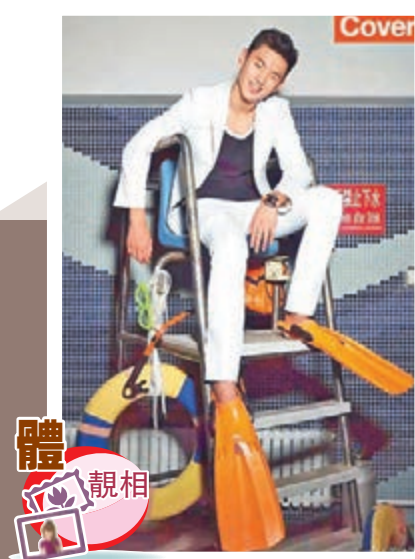
因奧運資格問題被內地傳媒炒得沸沸揚揚，但寧澤濤未受任何影響，專心備戰。日前，更為雜誌《GO》拍了一集封面照，相中的「游泳王子」帥氣逼人。