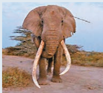
大象被長矛刺中。 網上圖片