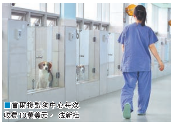
首爾複製狗中心每次 收費10萬美元。 法新社