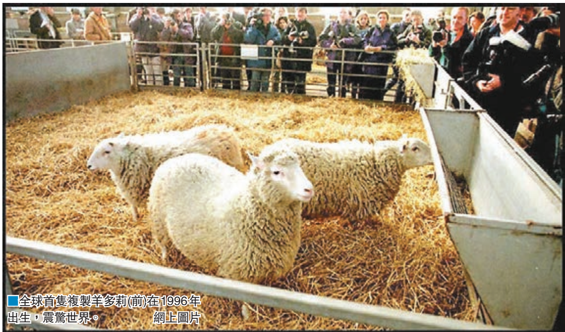
全球首隻複製羊多莉(前)在1996年 出生，震驚世界。