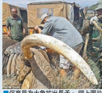
保育員為大象拔出長矛。

肯尼亞最老和最大的雄象「蒂姆」日前懷疑被農民攻擊，長矛插入耳朵，但牠竟然懂得負傷走到安博塞利國家公園求助，讓保育人員為牠拔出長矛。