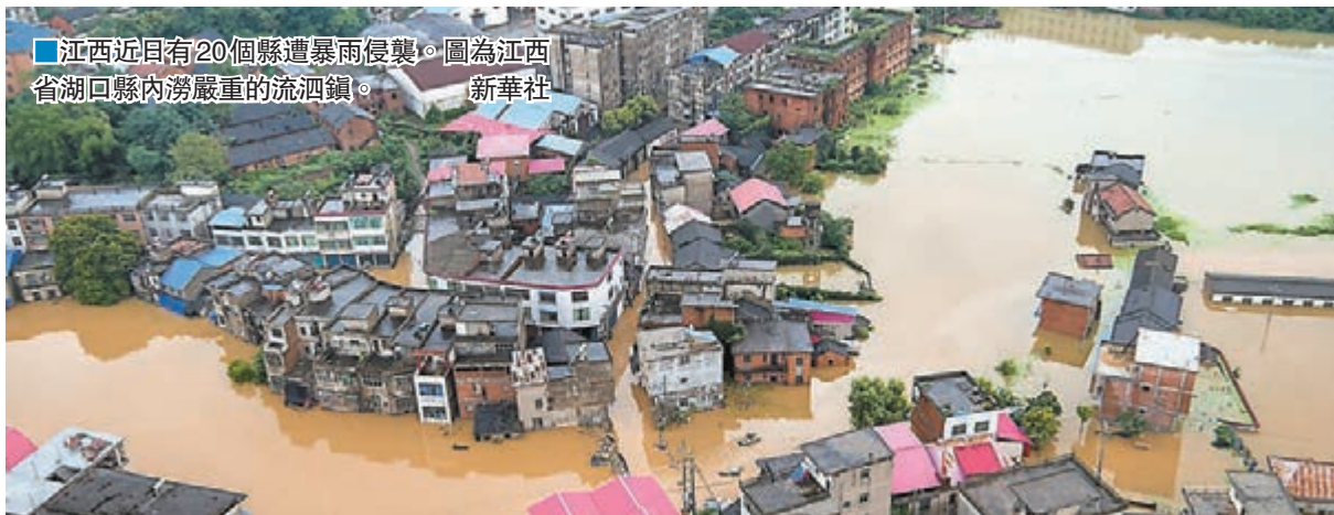
江西近日有20個縣遭暴雨侵襲。圖為江西省湖口縣內湧嚴重的流泗鎮。

香港文匯報訊(綜合記者王逍、趙臣 江西、安徽報道)長江中下游沿江地區及江淮、西南東部等地出現入汛以來最強降雨過程,自3日起,受長江上游來水加劇影響,內地最大淡水湖鄱陽湖今年首次出現長江江水倒灌現象,導致鄱陽湖水位一日暴漲半米。而預計本周在東南沿海登陸的一號颶風,將帶來大量降水,恐將導致汛情進一步惡化。