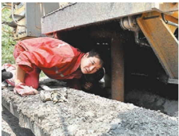
救援人員在聽井下被困礦工回應的敲擊聲。

完成初教機飛行訓練後,這53名學員將奔赴飛行學院進行為期一年的高教機訓練。其餘未通過初教機訓練的34名「雙學籍」學員中,有32人通過了空軍組織的畢業學員聯考,他們將於7月中旬畢業,同樣獲得「雙印」畢業證書和雙學士學位,再經過一年的任職培訓,將從事空軍地勤相應崗位的工作。