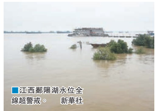
江西鄱陽湖水位全線超警戒。新華社