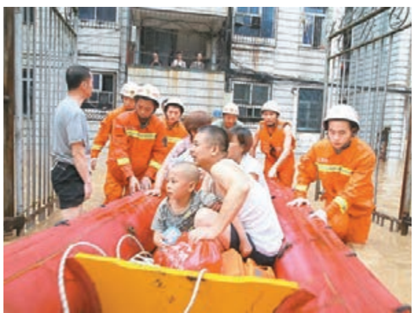
江西修水遭暴雨侵襲,消防官兵及時轉移被困群眾。

據了解,2日18時至3日18時,江西省有20個縣下大暴雨,其中彭澤縣以300.0毫米高居首位。3日16時,長江洪水倒灌鄱陽湖的流量達每秒9,100立方米。受地勢影響,在鄱陽湖與長江交匯的湖口,因鄱陽湖地勢比長江稍高,如長江不在高水位上運行,鄱陽湖的水可順利排入長江;而如果長江上游來水增加,長江在高水位運行,就會縮小這種「水位差」,形成頂托甚至倒灌情形。水利專家表示,鄱陽湖出現江水倒灌將有利於長江分洪,調蓄湖口以下長江水位。但目前湖區疊加贛北連續強降雨影響,已承受較大防汛壓力。