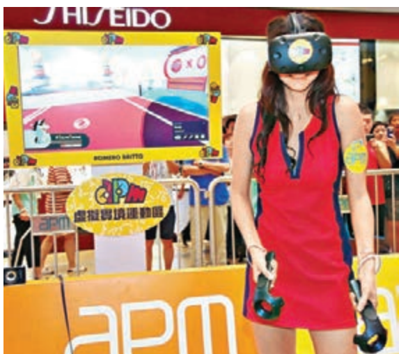
apm今個暑假引入虛擬實境運動遊戲。

她指,明白部分內地客的消费模式開始改變,由以往喜歡購買極高級消費品如珠寶、名錶等,轉向中高級消費,以名牌服飾及餐飲消費為主,故現時在推廣上也較為謹慎。