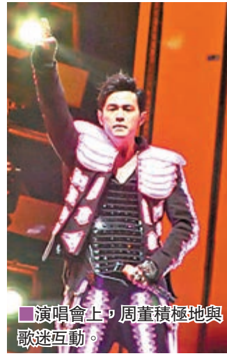
演唱會上，周董積極地與歌迷互動。