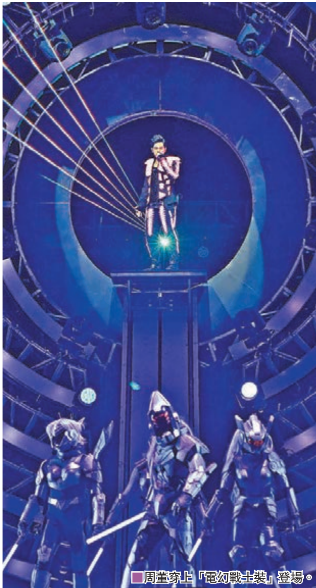
周董穿上「電幻戰士裝」登場。