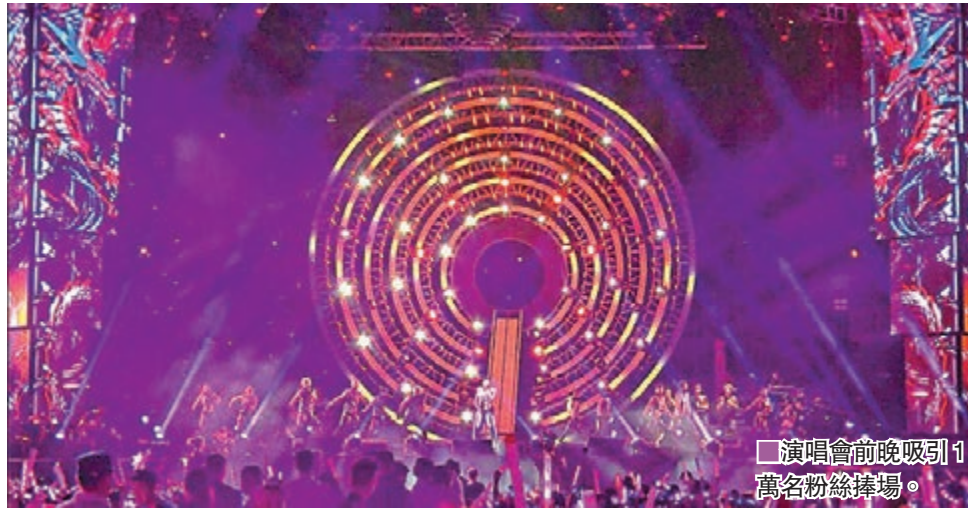
演唱會前晚吸引1萬名粉絲捧場。