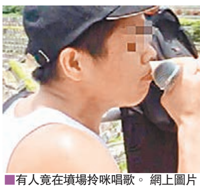
有人竟在墳場吟唱唱歌。網上圖片