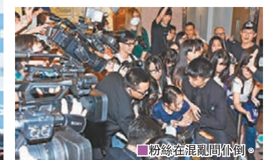
粉絲在混亂間仆倒。