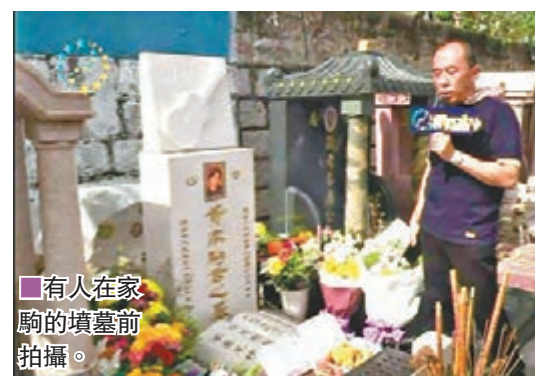
有人在家騎的墳墓前直播。