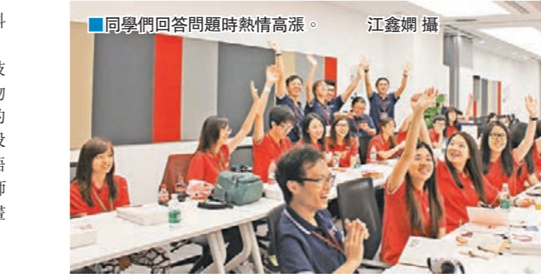
同學們回問問題時熱情高漲。

即將離京時，學員在日出前趕赴天安門廣場觀看升旗禮。聽着國歌奏起，學員全神貫注地注目禮。有同學表示，在天安門廣場前，嘹亮的國歌聲中親身體驗升旗，絕對是此次北京學習中深刻而難忘的時刻。