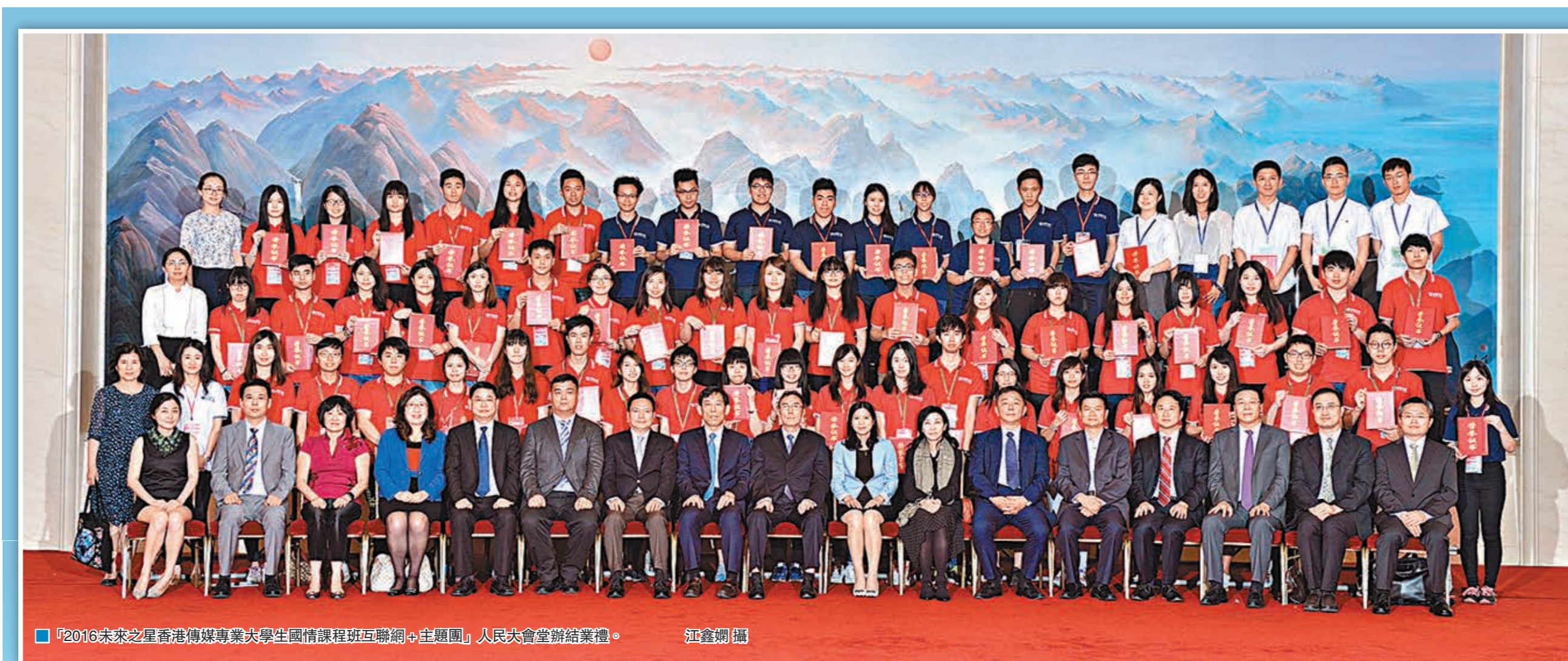
「2016未來之星香港傳媒專業大學生國情課程班互聯網+主題團」人民大會堂結業禮。

中央統戰部三局局長助理馮紅雲，香港特別行政區駐北京辦事處副主任蔣翠碧，香港大公文匯傳媒集團董事、未來之星同學會執行主席姜亞兵，中國互聯網發展基金會秘書長梁昌浩，國務院新聞辦公室處長謝德君等出席了活動。