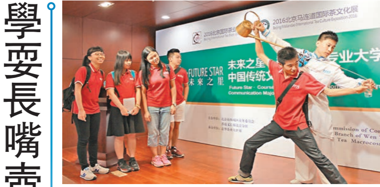
港生拜師學習長嘴壺表演。