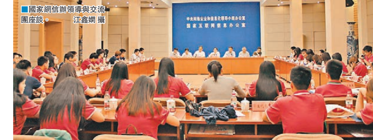
國家網信辦領導與交流團座談。

內地的互聯網管理部門的工作有哪些？內地在互聯網發展的同時如何保障民眾隱私？帶著這些疑問，「未來之星」於6月15日走進國家互聯網信息辦公室，與國家互聯網信息辦公室副主任徐麟，以及多位網信辦的局長面對面交流，親身了解國家部委的職能及內地互聯網行業的發展情況。