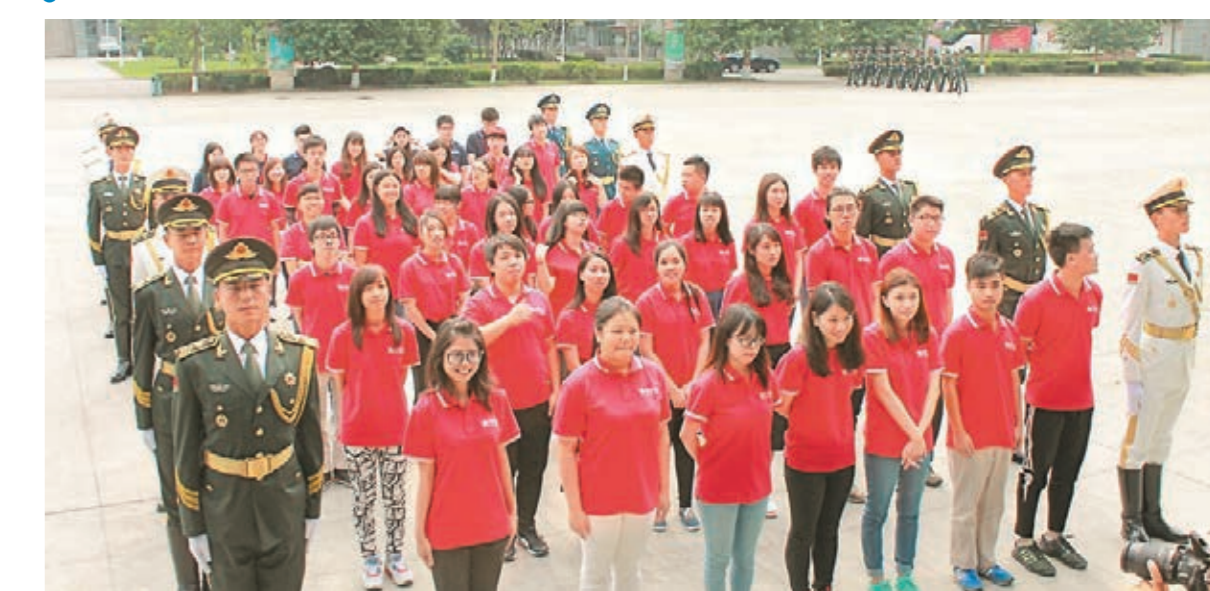
港生與儀仗兵同訓練。

「未來之星」在活動期間來到解放軍陸海空三軍儀仗隊，在訓練場觀看了儀仗隊以迎接外國元首規格展示的閱兵式、分列式表演。港生還親臨自降，接受儀仗隊戰士的訓練，體驗「儀仗兵」的感覺。參觀活動結束後，同學對儀仗隊員的威武風采、超越常人的訓練，以及對國家的奉獻精神大表敬服。