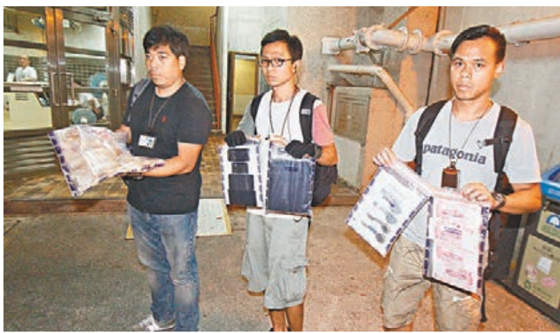
警方打擊非法外圍波纜中心，檢獲電腦、手機和現金等證物。

經特別職務隊深入調查後，很快鎖定將軍澳景明苑暉景閣一目標單位，至昨日凌晨零時許，特職隊人員採取代號「戈壁」行動，拖至該單位搜查，當場拘捕一名涉嫌非法收受賭注的男子，並檢獲約43萬元