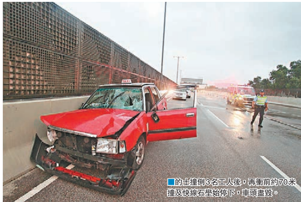
的士撞倒3名工人後，再衝前約70米撞及快線石壘始停下，車頭盡毀。

香港文匯報訊（記者 劉友光、杜法祖）青葵公路昨日凌晨發生釀成兩死兩傷的奪命車禍，一輛的士涉高速失控狂撼停在路中工程車後，再如打保齡般狂掃路中3名路政署外判修路工人，造成兩死一命危。肇事的士司機亦告受傷，他事後涉嫌「危險駕駛導致他人死亡」被捕。警方新界南總區交通部特別調查隊正循司機的精神狀況、駕駛態度，以及機件等多方向調查肇因。其中一名慘死工人遺下妻子及患血癌幼女，孤寡三口頓失所依，境況堪憐。