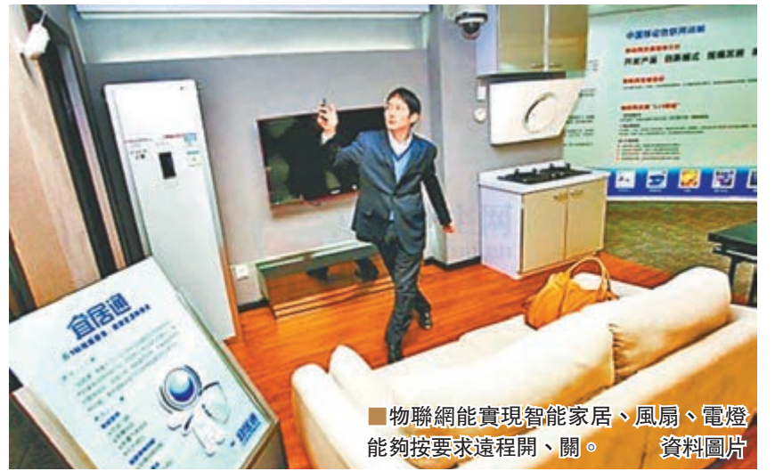
物聯網能實現智能家居、風扇、電燈能夠按需求遠程開、關。

世界銀行預計，2025年全球GDP達99.5萬億美元，物聯網將佔全球經濟的11%，隨著物聯網產業增長性持續看好，帶動全球科技基金逐步擺脫消費性電子範疇，轉聚焦新創科技應用，鎖定工業4.0等投資主題。