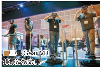
三星 Gear VR 模擬滑板效果。