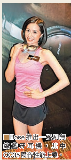
Bose 推出一系列無線藍牙耳機，其中 QC35 隔音性能上乘。