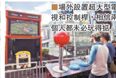
場外設置超大型電視和控制桿，相信兩個人都未必玩得掂。