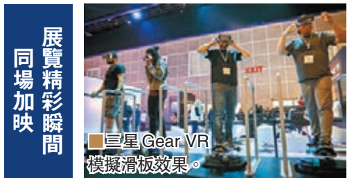
展覽精彩瞬間 同場加映