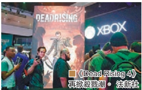
■《Dead Rising 4》再掀殺戮潮。