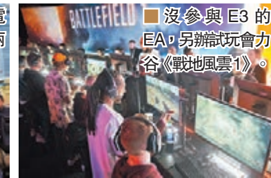
沒參與 E3 的 EA，另辦「玩會力谷」《戰地風雲 1》。