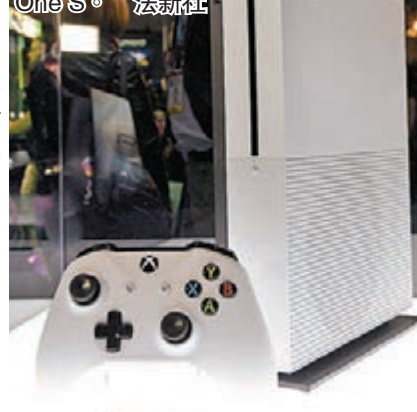
■若論微軟的最大亮點，似乎是這部纖薄版 Xbox One S。