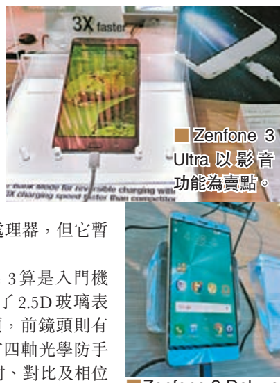
Zenfone 3 Ultra 以影音功能為賣點。

至於 Zenfone 3 Deluxe，採用一體成型的金屬機身，背面上完全沒有天線干擾。它選用 Qualcomm Snap-