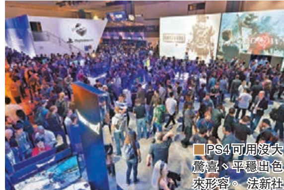
PS4 可用沒失驚喜、平穩出色來形容。

索尼方面在 E3 前夕，縱使確認了 PS4 強化版「PS Neo」的存在，卻表明不會在展覽中帶它出來，結果並沒有食言，連展前發佈會都隻字不提。已成市場領導者的 PS4，未有因此而放慢手腳，它首度披露了新一集《God of War》和以一對萬喪屍的《Days Gone》，還有開發經年之《The Last Guardian》終確定會在今年 10 月誕生，但論話題性還不如《潛龍諜影》創作人小島秀夫發表其自立門戶後頭炮、PS4 獨佔的《Death Stranding》那樣轟動。至於場內展出的作品，則不乏專為 PSVR 而設之流，包括射擊玩法的《Farpoint》、PS 獨家的《蝙蝠俠》與《FF15》VR 體驗等，其中以《蝙蝠俠》的評價最高，相信 PSVR 於今年 10 月正式發售時必掀搶購潮。