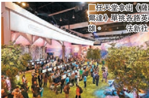
任天堂拿出《薩爾達》單挑各路英雄。

早已揚言會收起新主機 NX 不讓它曝光的任天堂，沒想過竟大膽到只拿一隻《薩爾達傳說 Breath of the Wild》便來進駐 E3，會場內連《Pokemon》的蹤影也沒有，可見幕後對這隻相隔五年多的家用機全新作極有信心。預定明年橫跨 Wii U 和 NX 發售的它，是遊戲系列首度採用開放世界玩法，不少傳媒都認為其畫風甚有宮崎駿的吉卜力工作室的格調，操作不算太困難卻有其深度，難怪慕名而來試玩的人極多，堪稱今屆 E3 的排隊王。另外，任天堂沒舉行展前發表會，只是在網上播放了《薩爾達》和《Pokemon》新一集《太陽／月亮》的實機畫面，但已夠人津津樂道。