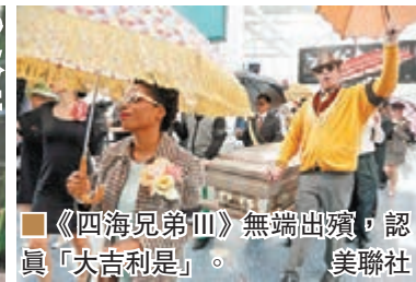
《四海兄弟 III》無端出陣，認真「大吉利是」。美聯社