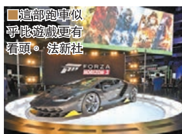
這部跑車似乎比遊戲更有看頭。

就算在亞洲市場不容易收復失地，但 Xbox One 於歐美其實表現不俗，尤其在北美屢次力壓 PS4 成為月內銷售冠軍，就知今場主機大戰尚未分出高下。今年 E3 微軟一如以往擺出強陣，《Gears of War 4》、《Forza Horizon 3》、《Halo Wars 2》這類續集固然搶鏡，也有請來日本創作人幫手的《Scalebound》與《ReCore》助陣，遊戲叫座力不比索尼遜色，只是欠缺去年 Hololens 那種能引起話題的震撼感。不過，微軟應對 PS4 加強版「PS Neo」充滿戒心，前者先發表最快 8 月面世，可垂直擺放兼對應 4K 影片的纖薄版 X1 主機 Xbox One S，同時為現有主機減價；另外預定明秋推出性能強一大截之 X1 強化版「Project Scorpio」，其可玩 4K 遊戲與對應 VR 配件的設定，絕對為 PS Neo 構成壓力。