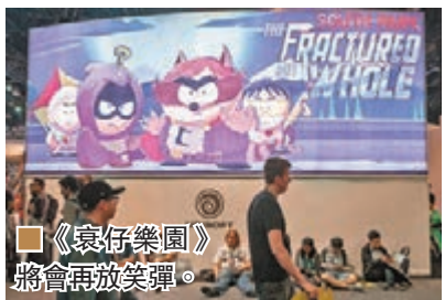
■《袁仔樂園》將會再放笑彈。

法國大廠 Ubisoft 舉動積極，佳作接踵而來下已成為當今最具影響力的第三廠商。儘管早已宣佈今年不會有《刺客教條》列陣，但廠方仍是「大把在手」，單是已宣佈會籌拍荷里活真人電影版的《看門狗》(Watch Dogs)，其定於今年 11 月中旬推出的遊戲續篇便足夠令來賓高呼興奮。全平台對應的《看門狗 2》不再由 Aiden 做主角，改為同樣精通於駭客技術的 Marcus 迎戰食腐的三藩市官僚，而新主角的跑酷能力讓他可在各棟大廈間飛簷走壁行動。此外，這公司亦展出《火線獵殺：野境》(Ghost Recon Wildlands)和《榮耀戰魂》(For Honor)等「打餐飽」遊戲。除了較硬派的作品外，Ubisoft 亦不忘照顧一家大細需要，不乏追隨者的《袁仔樂園》(South Park)系列今年 12 月初將會有大玩超級英雄橋段的 RPG《The Fractured But Whole》，製作人表明會比三年前那一集更瘋狂抵死。