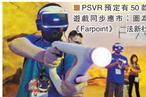
PSVR 預設有 50 款遊戲同步應市；圖為《Farpoint》。