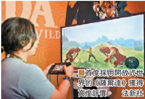
首度採用開放式世界的《薩爾達》獲得高度評價。

早已揚言會收起新主機 NX 不讓它曝光的任天堂，沒想過竟大膽到只拿一隻《薩爾達傳說 Breath of the Wild》便來進駐 E3，會場內連《Pokemon》的蹤影也沒有，可見幕後對這隻相隔五年多的家用機全新作極有信心。預定明年橫跨 Wii U 和 NX 發售的它，是遊戲系列首度採用開放世界玩法，不少傳媒都認為其畫風甚有宮崎駿的吉卜力工作室的格調，操作不算太困難卻有其深度，難怪慕名而來試玩的人極多，堪稱今屆 E3 的排隊王。另外，任天堂沒舉行展前發表會，只是在網上播放了《薩爾達》和《Pokemon》新一集《太陽／月亮》的實機畫面，但已夠人津津樂道。