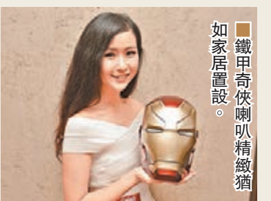
鐵甲奇俠喇叭精緻猶如家居置設。

作為 Marvel 及《鐵甲奇俠》的擁躉，最近筆者發現了一座名為 Iron Man Mark XLIII 1/1th Scale 的藍牙喇叭，顧名思義其外形是根據 Mark XLIII 的頭盔來設計，可用藍牙連接、插線或插 USB 手指播歌。從表面看，它不似喇叭，像是一件裝飾品，但當仔細看便發現頭盔兩邊確是藏有喇叭，而後邊有 USB 及 3.5mm 耳筒插位，方便直接插上裝置來播放。頭盔高度是 202mm，預計售價為 450 美元。文、圖：雨文