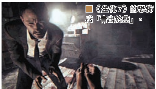
■《生化 7》的恐怖感「青出於藍」。

另外，Capcom 為 Xbox One 開發之喪屍大屠殺作品《Dead Rising 4》亦首度曝光，故事返回初代的城鎮，由元祖攝影師主角 Frank West 重披戰衣，今次無論暴力、惡搞以至聲畫效果均比前年的第三集更佳。最重要是 Xbox 版只有一年獨佔期，換言之 PS4 用家只需等一年便能玩到；第四集將於 12 月 6 日發售。