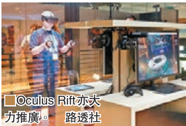
Oculus Rift 亦大力推廣。