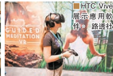
HTC Vive 展示應用軟件。