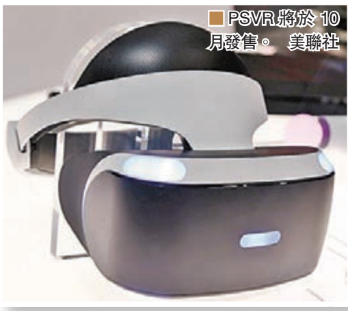
PSVR 將於 10 月發售。