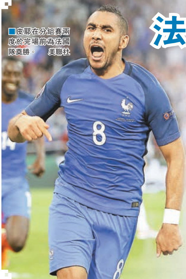
■皮耶在分組賽兩度於完場前為法國隊奠勝。