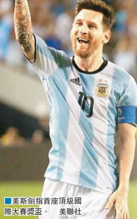
■美斯劍指首座頂級國際大賽獎盃。