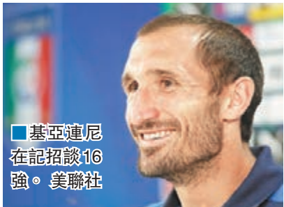
■基亞連尼在記招談16強。

英格蘭在歐洲國家盃16強對冰島賽前，傳出隊內部分球員不滿主帥鶴臣在分組賽的排陣和戰術，而前鋒哈利卡尼更公開指自己沒入球是因「傳球供應不足」，昨天還有翼鋒拉爾拿拿疑受傷令鶴臣大為頭痛。