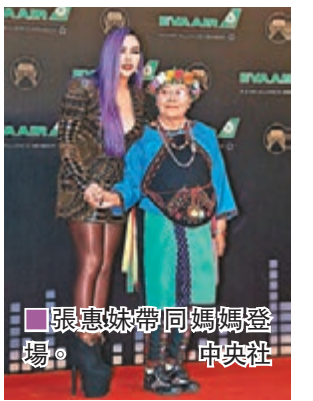
■張惠妹帶同媽媽登場。