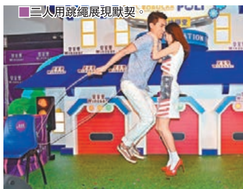
■三人用跳繩展現默契。