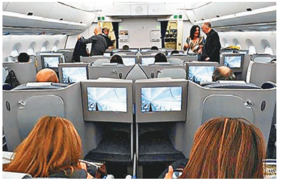
■一般航機的票價分3級，最好的 First Class，價錢自然也就最貴。 資料圖片

還未到吃飛機餐的環節嗎？是啊，誰叫這是長途機呢，下期繼續…… (To be continued.....)