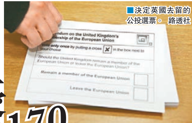
決定英國去留的公投選票。