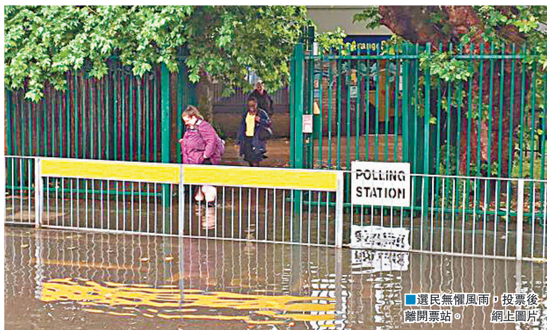
選民無懼風雨，投票後離開票站。