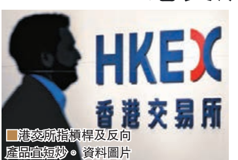
港交所指槓桿及反向產品宜短炒。資料圖片

香港文匯報訊(記者 歐陽偉昉)香港首4隻槓桿及反向產品上週二上市,港交所(0388)高級副總裁及ETF主管羅博仁昨於傳媒工作坊表示,現階段只接受廣泛流通及覆蓋全面的海外股票指數相關產品上市,但會在6個月後進行檢討考慮容許與香港股票、固定收入等指數有關,或槓桿較大的產品上市。羅博仁指出,有關產品旨在提供相關指數