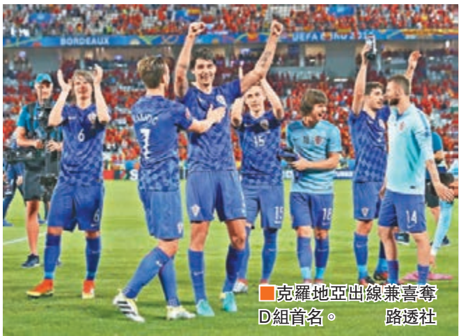
■克羅地亞出線兼喜奪D組首名。