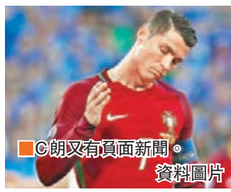
■C朗又有負面新聞。

葡萄牙今屆歐國盃沒踢出霸氣，隊中「球王」C·朗拿度心情肯定不會好，雖然早前被指要大牌拒換球衣一事獲得平反，但昨天又爆出負面新聞，今次更將記者的咪高峰拋落湖裡。昨天備戰匈牙利前，C朗和隊友一起散步，當時一位記者衝上前問C朗「今晚比賽準備好了？」時，C朗突然將記者手中的咪高峰搶走並掙入旁邊的湖裡。據報，該記者衝過了保安線違反了傳媒的採訪規定，加上該記者曾爆C朗的私隱，才令他怒不可遏。