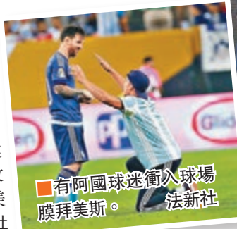
■有阿國球迷衝入球場膜拜美斯。

下半場開始前出現了一段小插曲，一名球迷衝入場內向「球王」美斯做出拜倒的動作並和他擁抱，隨後被保安請離場。50分鐘，希古恩接應隊友長傳小禁區內施射被門將撲到後再補中。希古恩在85分鐘接應美斯助攻錦上添花，最終上屆亞軍阿根廷再次殺入美洲盃決賽。