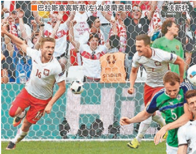
■巴拉斯塞高斯基(左)為波蘭奠勝。