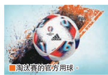
■淘汰賽的官方用球。

今屆歐洲國家盃的16強淘汰賽階段將於本港時間周六晚上開戰，由於英格蘭跟西班牙屈居小組次名，令原本已首名出線的東道主法國、意大利和德國的晉級「下線」更添「死亡」味道。「上線」方面，不計今晨決出的F組賽果和第3名出線位置，暫有威爾斯、波蘭、瑞士、克羅地亞等球隊，晉級形勢有利黑馬分子突圍躋身冠軍戰。