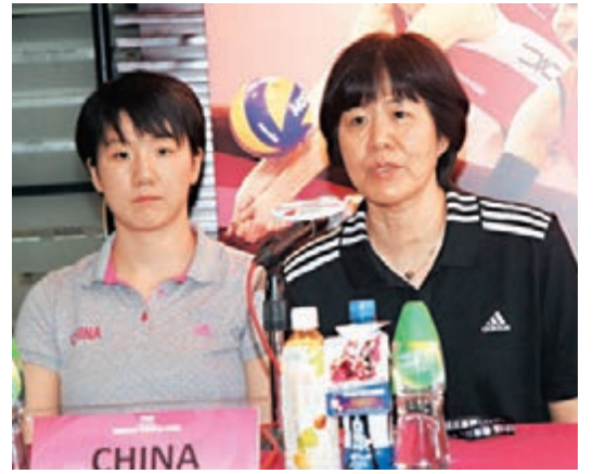
中國女排主教練郎平(右)回答提問。

另外,郎平也談到只是19歲的小將龔翔宇,她認為這位小將能力還差得很遠,「觀眾可能看到她扣球好的一面,其實在教練眼中,她都有不足,如防守和失誤。她的路還有很遠,希望她有更快的成長,而傳媒少點吹捧,不要令她帶來壓力。」