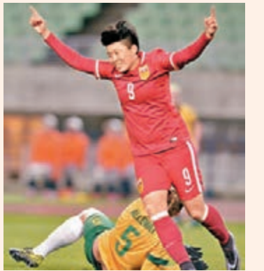
中國女足隊員馬曉旭。

16年、20年,都是值得的。」馬曉旭說。遙想少年成名時,馬曉旭經常依靠一己之力決定比賽勝負,里約奧運會上,她是否能找回當年之勇?馬曉旭坦言,「以一個人的力量拯救中國隊,已經不可能了。能把現在的馬曉旭展現出來,就夠了。而且足球是個團隊項目,奧運會是有所有人的夢想,大家的夢想,大家一起完成,把所有的能力奉獻給國人。」