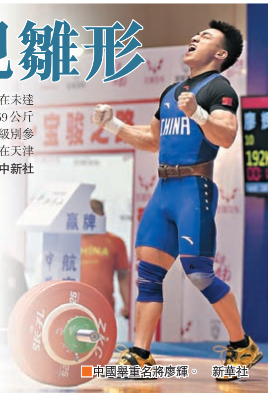
中國舉重名將廖輝。