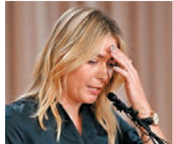
俄羅斯網球手舒拉寶娃。