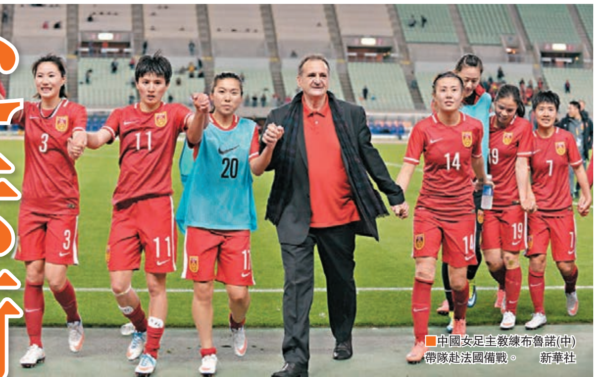
中國女足主教練布魯諾(中)帶隊赴法國備戰。