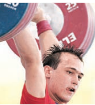
哈薩克舉重選手伊林。