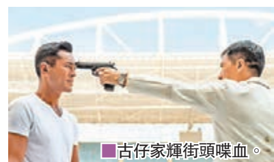
古仔家輝街頭喋血。