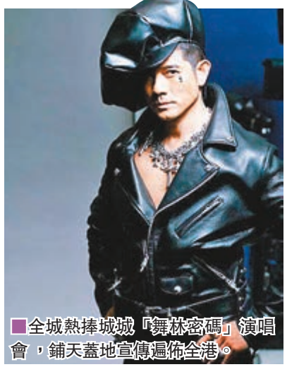
全城熱捧城城「舞林密碼」演唱會，鋪天蓋地宣傳遍佈全港。

另外，有消息指，王菲將於12月30日假上海舉行演唱會，有傳開出1億人仔(約1.7億港紙)天價代理費，近日上海文化廣播影視管理局官網亦有顯示，消息指阿里巴巴已經投得王菲演唱會的主辦權。對於王菲復出開騷一事，經理人陳家瑛接受訪問表示：「阿菲的確是會在年底開演唱會，至於詳情暫未可公佈，到時間成熟一定會通知大家。」