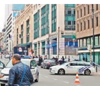
大批警員封鎖商場附近一帶。

比利時一名懷疑患精神病的精神病男子前日報警，聲稱遭人綁上炸彈腰帶，帶到首都布魯塞爾City 2購物中心，準備發動自殺式襲擊。警方到場後，發現該男子的腰帶只裝滿食鹽及餅乾，即時拘捕他，並帶走接載他的司機問話。該男子最近曾向警方稱，他獲邀前往敘利亞加入極端組織「伊斯蘭國」(ISIS)。當局相信今次事件屬惡作劇，正調查他是否與恐怖組織有關。