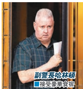
副警長哈林頓 接受豪華食宿

美國紐約市警隊涉貪醜聞不斷，前日再有兩名高級警務人員被捕，他們涉嫌接受當地一名富商提供妓女、體育比賽門票及豪華食宿等總值逾10萬美元(約78萬港元)的「好處」，換取為對方提供各種方便，包括封路、申領槍牌、豁免抄牌及處理私事等。聯邦檢察官稱涉案富商「買來了一隊私人警隊」，又形容涉案警員如「應召警察」。