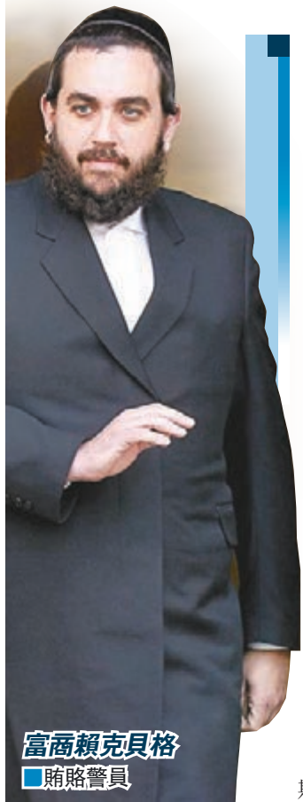
富商賴克貝格 賄賂警員

美國紐約市警隊涉貪醜聞不斷，前日再有兩名高級警務人員被捕，他們涉嫌接受當地一名富商提供妓女、體育比賽門票及豪華食宿等總值逾10萬美元(約78萬港元)的「好處」，換取為對方提供各種方便，包括封路、申領槍牌、豁免抄牌及處理私事等。聯邦檢察官稱涉案富商「買來了一隊私人警隊」，又形容涉案警員如「應召警察」。