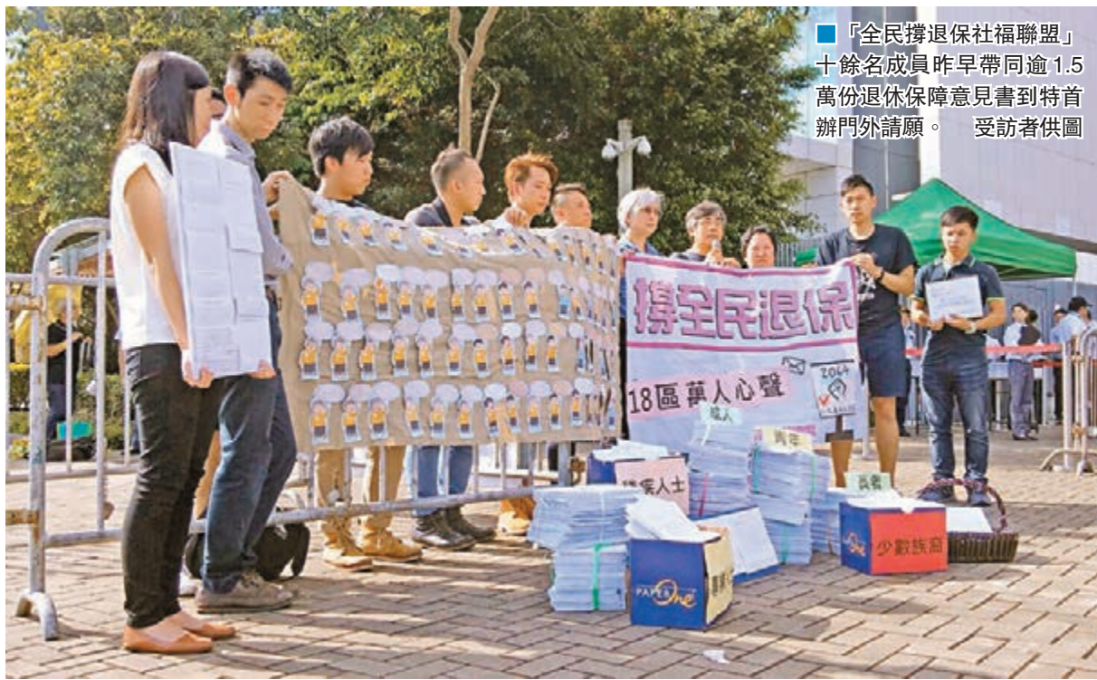
■「全民撐退休保障聯盟」十餘名成員昨早帶同逾1.5萬份退休保障意見書到特首辦門外請願。

香港文匯報訊(記者 文森)特區政府扶貧委員會的退休保障諮詢昨日結束,當局指截至6月20日,共收到約1,200份意見書。由於昨日陸續收到大量意見書,部分仍在點算中。行政長官梁振英昨早出席行政會議前表示,感謝社會各界人士在過去半年提出各種意見,港府會盡快將該些意見分析、整理,然後理順出一個方向。有學者擔心,特區政府以社會沒有共識為由,不推行任何退保方案。