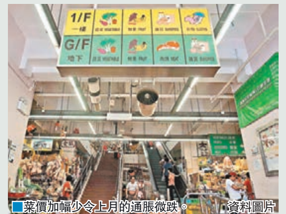
■菜價加幅少令上月的通脹微跌。

香港文匯報訊(記者 聶曉輝)政府統計處昨日公佈,今年5月份的綜合消費物價指數按年升2.6%,較4月份的2.7%相應升幅稍低。剔除所有政府一次性紓困措施的影響後,5月份的基本通脹率為2.2%,亦較4月份的2.3%稍低,主要是新鮮蔬菜價格升幅收窄所致。