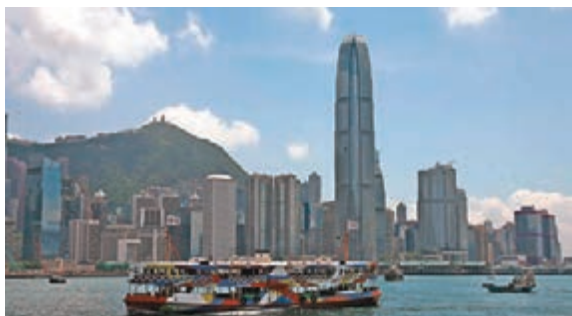
■調查指港在「成長競爭力排行榜」上跌至第二十五位,較去年下跌一位。

首位。同時,香港在「成長競爭力排行榜」上跌至第二十五位,較去年下跌一位。不過,香港在最佳食品安全城市、最安全城市、最乾淨城市及最誠信城市上均名列首位。