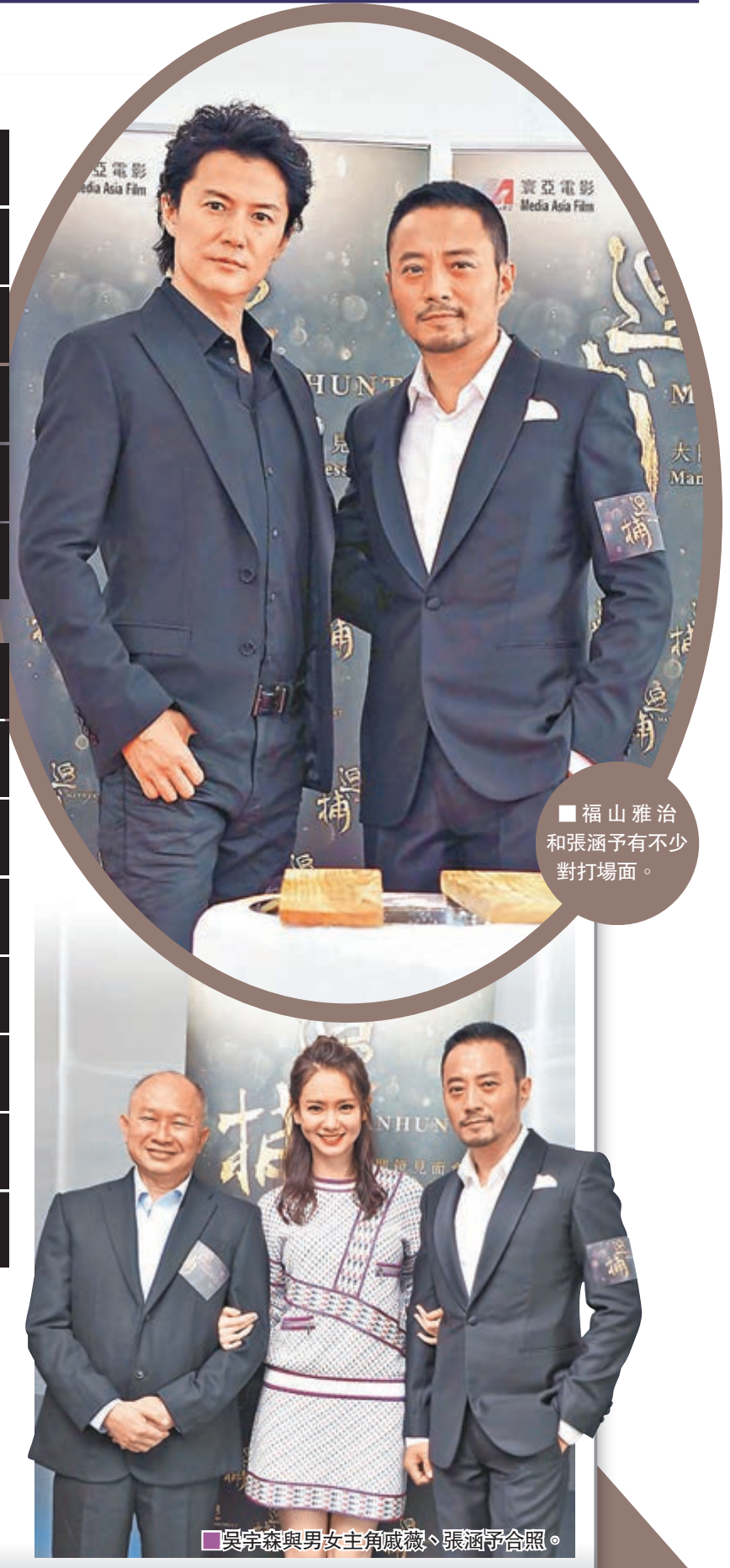
福山雅治和張涵予有不少對打場面。