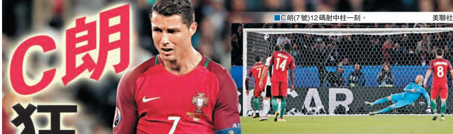
■C朗(7號)12碼射中柱一刻。