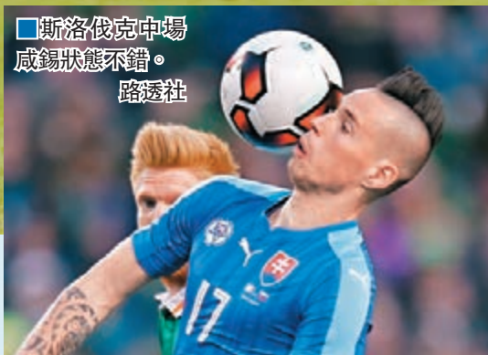
■斯洛伐克中場威錫狀態不錯。