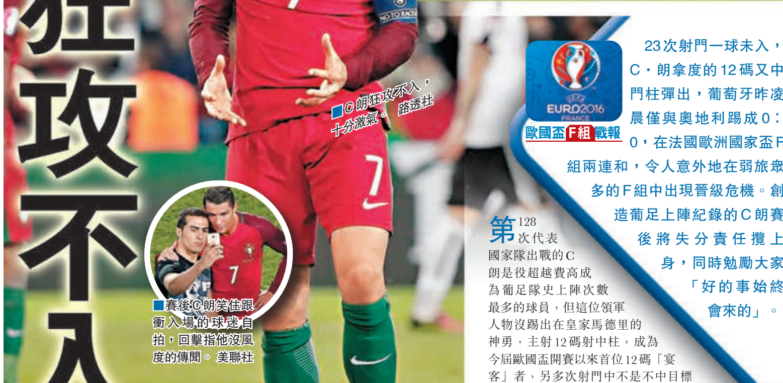
■C朗狂攻不入，十分激氣。