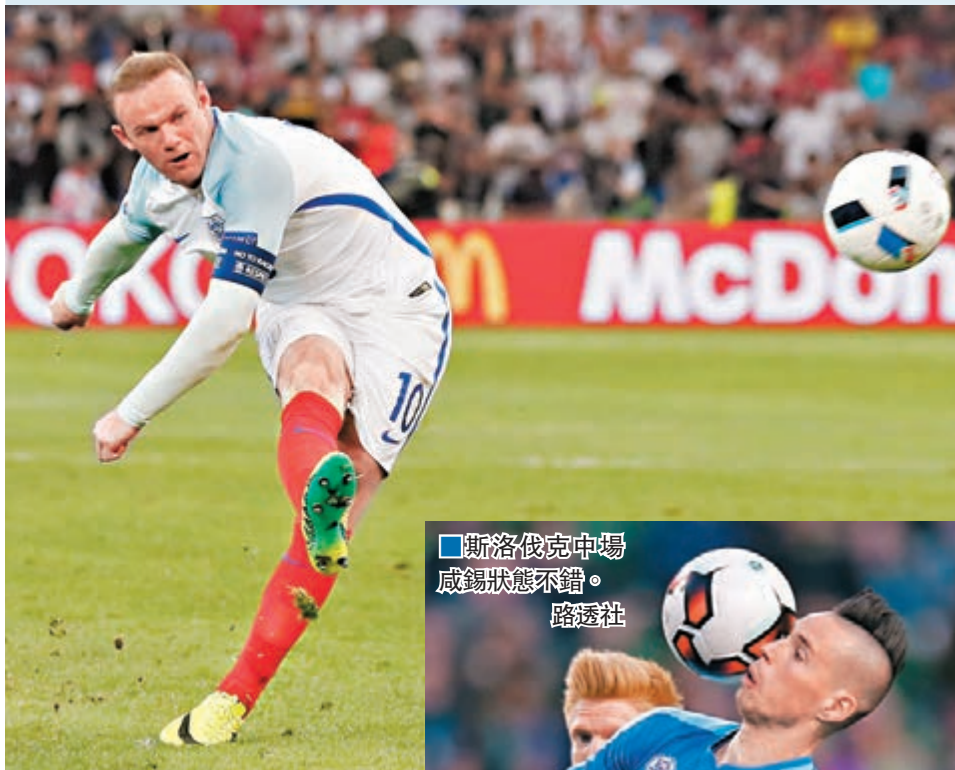
■朗尼隨後為英格蘭組織攻勢，表現更好。