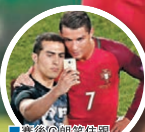
■賽後C朗笑住跟衝入場的球迷自拍，回擊指他沒風度的傳聞。