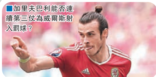
■加里夫巴利能否連續第三仗為威爾斯射入罰球？