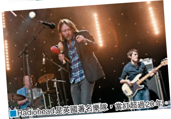
Radiohead是英國著名樂隊，當紅超過20年。

土耳其宗教激進勢力近年抬頭，相關襲擊事件持續增加。最大城市伊斯坦布爾上週五晚有20多名男子，襲擊當地一間唱片店，不滿聚集的樂迷在伊斯蘭教齋戒月期間飲酒，導致最少2人受傷。當地前日有500多人上街，聲援遇襲歌迷，最終演變成反政府示威，警方動用催淚氣體、水炮及橡膠子彈驅散。