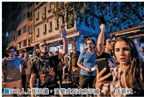
500人上街抗議，演變成反政府示威。

這時多名男子突然闖入，指各人在齋戒月飲酒，應該感到羞恥，揚言要放火燒死他們，說罷便以玻璃樽及木棍攻擊歌迷和店員，並大肆破壞店舖，其後悻然離去，更警告各人不得再喝酒。事件導致最少2人受傷，其中一名歌迷頭部被玻璃樽擊中，血流如注，需要送院治理，亦有多名女性遇襲。