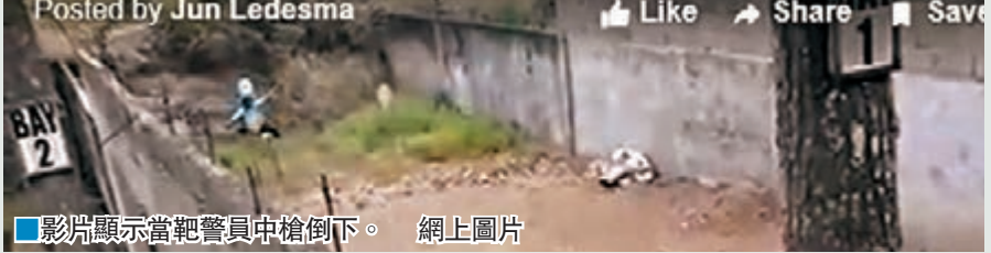
影片顯示當靶警員中槍倒下。