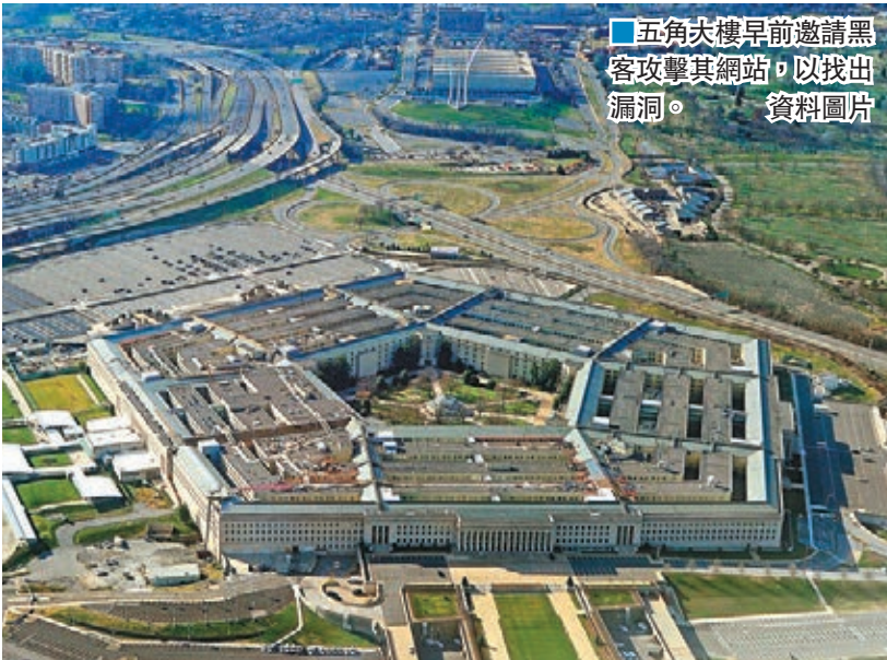
■五角大樓早前邀請黑客攻擊其網站，以找出漏洞。

美國國防部3月發起「入侵五角大樓」(Hack the Pentagon)活動，邀請通過審查的黑客攻擊國防部網站，以找出潛在漏洞。防長卡特前日透露，受邀的1,410名黑客在4月18日至5月12日期間，共找出138個漏洞，其中1名黑客只是高中生，他合共找出6個漏洞，獲卡特點名讚揚。