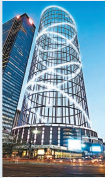
■構思中的透明高塔