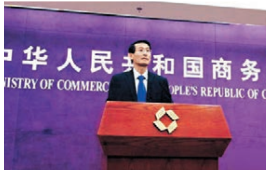
沈丹陽稱,中韓自貿協定對提振企業信心發揮積極作用。

香港文匯報訊(記者 馬琳 北京報道)中韓自貿協定簽訂已有一周年,但今年前四個月中韓貿易並未如預期增長。對此,中國商務部新聞發言人沈丹陽昨日在例行發佈會上表示,今年前幾月中韓貿易規模略有下降,主要受國際市場需求低迷導致的商品價格下降,中韓兩國經濟結構調整形成的短期需求變化,以及相關國家貨幣匯率波動等因素影響。中方對中韓貿易未來發展前景仍充滿信心,看好今年下半年中韓貿易進一步的增長。