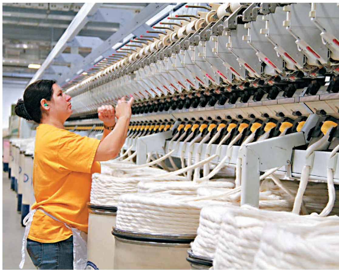
內地投資者投資目的地主要集中在中國香港、東盟、歐盟、澳洲、美國、俄羅斯和日本等七個主要經濟體。圖為中國企業在美國南卡羅萊納州投資建造的紡紗廠。資料圖片

對於全年對外投資及吸引外資的整體走勢,沈丹陽判斷,按照常規統計數字,今年對外投資規模會超過利用外資的規模。