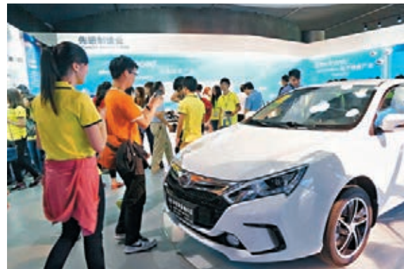
近年來,新能源汽車、智能家電等升級類商品需求旺盛。圖為內地一個新能源汽車展覽。資料圖片

分析認為,隨著內地城鎮化進程以及中產階層對生活品質要求的提升,各個領域都存在巨大的消費升級。高盛全球投資研究所發佈的2015年《中國消費者新消費層層崛起》報告曾指出,中國城市中產消費者的人數已經超過億,有1.46億,他們的人均年收入在11,733美元。這1億多中產消費者連同另外2.36億的城市大眾消費者更追求有品質的消費。