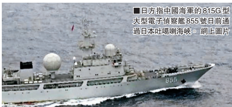
日方指中國海軍的815G型大型電子偵察艦855號日前通過日本吐噶喇海峽。

香港文匯報訊 據中新社報道,發言人華春瑩在昨日的例行記者會上針對日方就中國軍艦日前通過日本上答記者問時表示,中國軍艦通過吐噶喇海峽一事表態,中國外交部 吐噶喇海峽是根據《聯合國海洋法