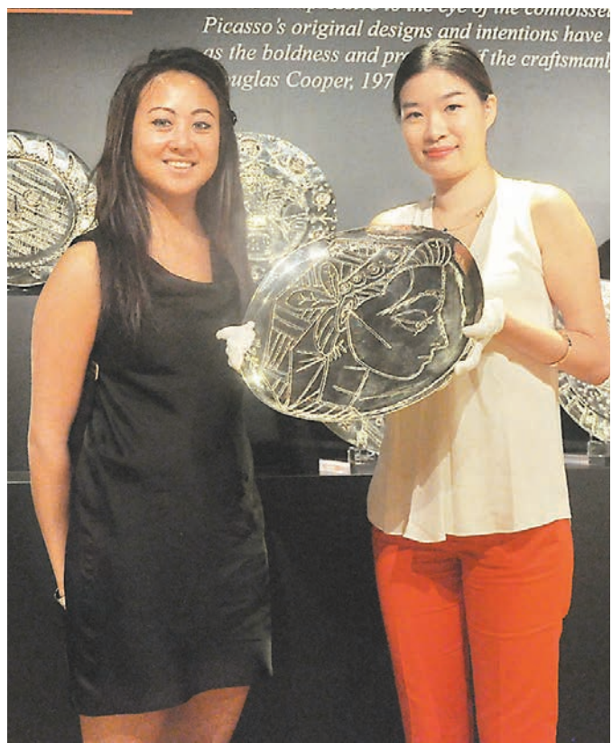
《賈桂琳側臉》是畢加索為愛妻賈桂琳·洛克而創作。

拍賣場並展示眾多藝術家設計的桌子、地毯、燈飾、環保座椅等日常傢具用品，估價為幾萬元至十幾萬元。由著名藝術家尹夫·克萊因設計的《黃金桌》，由22K金箔鑲嵌於桌面內部製成，熠熠生輝，估價15萬港元至25萬港元。位於桌子下面的《紅藍之愛》地毯，由藝術家羅伯特·印第安納設計，估價3萬港元至5萬港元，普羅大眾亦可負擔。