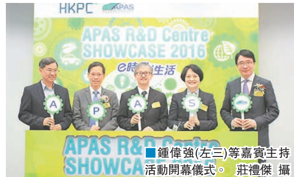
鍾偉強（左三）等嘉賓主持活動開幕儀式。

香港文匯報訊（記者 文森）科技不斷發展，電動車在本港愈見普及，配套愈見成熟。生產力促進局下的香港汽車零件研發中心昨日舉辦活動，展示電動車零件系統、充電等技術，亦有多場技術講座探討新能源汽車科技發展及商機，其中創新及科技局副局長鍾偉強到場主持開幕儀式。