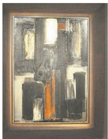
《油畫92x65cm, 1955》估價高達650萬港元。