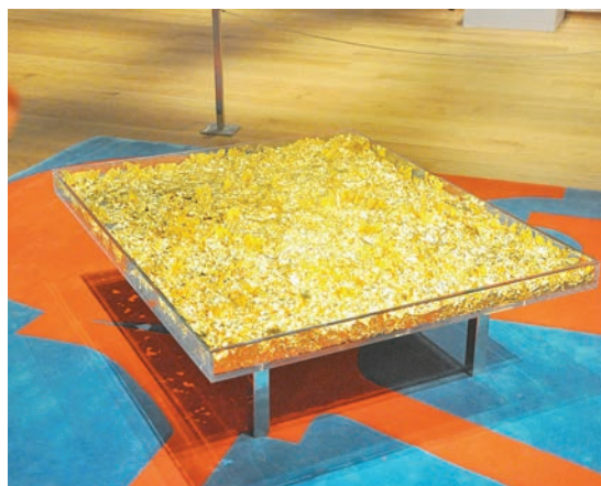
《黃金桌》由22K金箔鑲嵌於桌面內部製成。