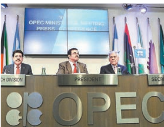
■ 石油輸出國組織（OPEC）由各石油產出國組成，為平衡國際的石油價格，OPEC會限制各組織國每年產出多少石油。

競爭者之間互通協議來限制產量，令價格上升。 例子：石油輸出國組織（OPEC）曾協議限制產量，訂出各成員國的石油產量配額，令石油價格維持一定水平。