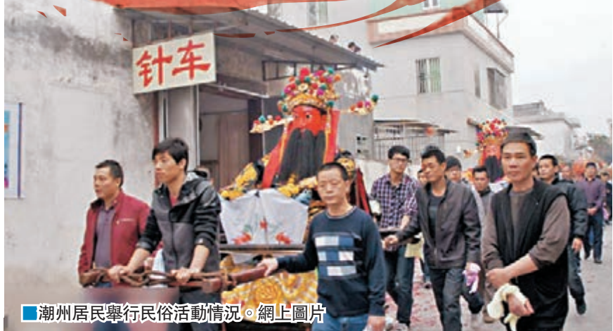
■ 潮州居民舉行民俗活動情況。網上圖片

式（即四合院四條柱都是金，稱之為風水大宅），建築群彼此依存，互相穿構，景觀與自然共生，整體和諧美好。港人要欣賞典型的潮汕建築，當屬潮安龍湖古寨、潮陽波美村和鮑浦蓬洲古城。