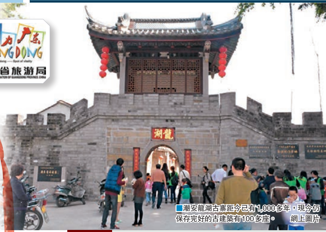
■ 潮安龍湖古寨距今已有1,000多年，現今仍保存完好的古建築有100多座。