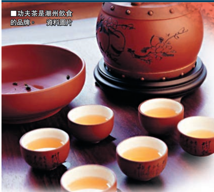
■ 功夫茶是潮州飲食的品牌。資料圖片