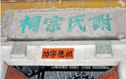
■ 鮑浦蓬洲古城的宗族文化延續至今。

蓬洲鄉位於汕頭鮑浦，也是一座千年古城。散落的明清古民居，是到蓬洲鄉必定要去的地方。建於明朝年間的莊氏十三落大宅，是蓬洲鄉里不得不看的古民居建