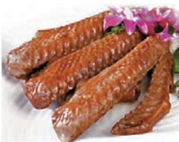
■ 滷鵝翼是潮州美食。

潮汕飲食主要分為潮菜和功夫茶兩類。潮菜最著名的是各類滷水、醃製河鮮等特色冷盤，如滷鵝肉、滷鵝翼。糜文化，也是潮汕飲食的一大特色。粽球、手搥牛肉丸、墨魚餅、炒糕粿、蝦卷、老菜脯、潮汕魚丸都不能錯過。