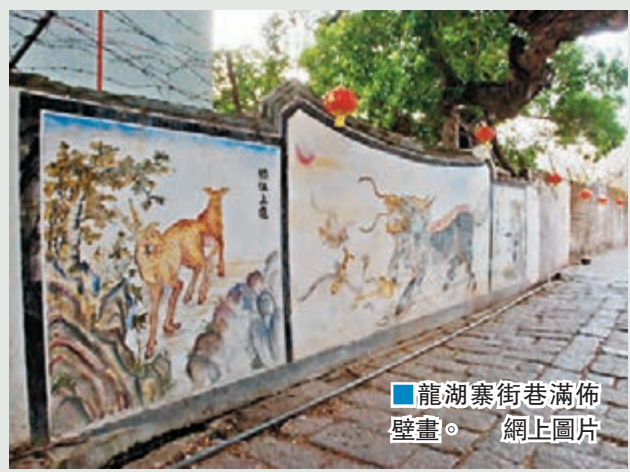
■ 龍湖寨街巷滿佈壁畫。

★ 鑑賞特色：寨中尚保存著小量線條洗煉的宋式建築構件；大量帶簡約風格的明式建築；華貴尚美、精雕細刻的清式建築；帶太平洋彼岸裝飾風格的偽舊建築。可謂為古今並存、中西兼有、花樣百出，不失為一座潮州民居建築的博物館。