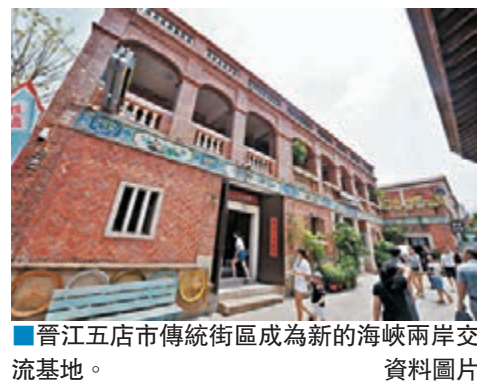
晉江五店市傳統街區成為新的海峽兩岸交流基地。資料圖片

另外，記者會有媒體提問，蔡英文24日出訪巴黎，本來期待是不期而遇的「習蔡會」（指大陸領導人習近平與蔡英文會面），但大陸派的是層級較低的商務部副部長，如何看待這件事？馬英九表示，「我不曉得誰會期待有『習蔡會』」，大陸跟巴黎沒有邦交，沒有派元首去是很自然的事，所有人都知道大陸不會派高層去，「這是可預料到的」。