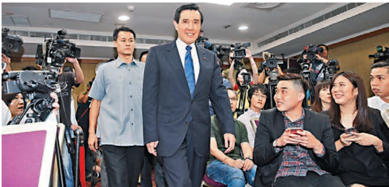
台灣地區前領導人馬英九昨日在記者會上表示，不排除會再去香港，更稱知密或涉密不等於洩密。

香港文匯報訊 台灣地區前領導人馬英九受邀赴香港亞洲卓越新聞獎頒獎典禮發表英文演說，因被台灣地區領導人蔡英文辦公室駁回申請，他15日晚透過錄影發表演說。為了讓外界進一步了解演講內容，馬英九昨日上午舉行記者會進行說明，會上他表示不排除以後再去香港。他更回應「洩密疑慮」，稱身為台灣地區前領導人，八年內當然知道很多機密，但知密或涉密不等於洩密。若假定知道得多就會洩密，這像是「有罪推定」。