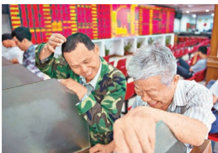
上證綜指昨報收2,887點,升1.58%。

盤面來看,多數股類均告上漲,其中鋰電池概念股爆發,分類漲幅超6%。充電樁、超級電容、特斯拉、青海股票、包裝