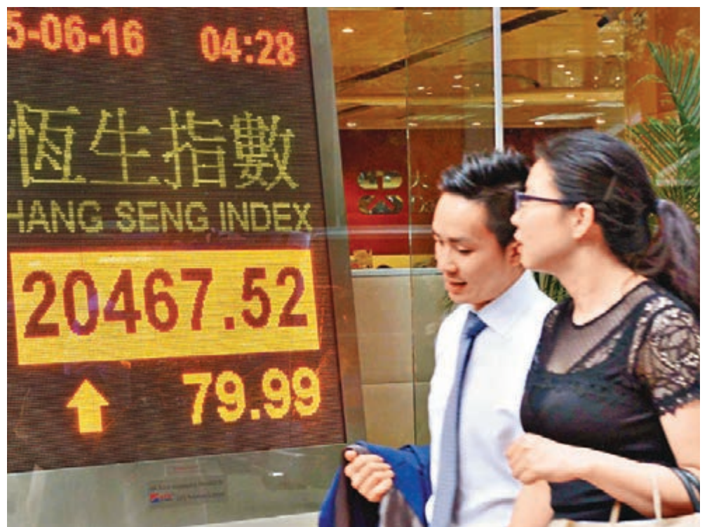
恒指昨先跌後升,收報20,467點,升0.39%。

日,加上中石化(0386)除淨,早段曾跌過2%,但後來里昂上調其目標價至7元,摩通亦建議「增持」,結果全日拗腰倒升逾1%。個別股份有炒作,霸王(1338)尾市升逾16%,衍生(6893)及豐盛(0607)等盤中也破頂,收市各漲7.7%及5%。撇除去年的一筆過收益後,創維(0751)全年度淨利潤仍上升23%,也令其股價大漲近一成。蘋果概念股繼續有資金追入,瑞聲(2018)獲瑞信上調目標價,收市再升2.1%。